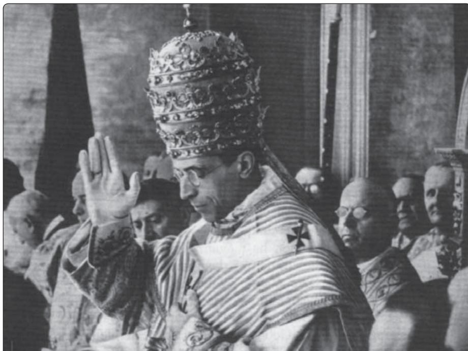
Eugenio Maria Giuseppe Giovanni Pacelli byl zvolen papežem 2. března 1939 po jednodenním konkláve. Zvolil si jméno Pius XII. Od roku 1917 do roku 1930 působil jako nuncius nejdříve v Bavorsku, pak v Německé říši. Od roku 1930 byl kardinálem-státním sekretářem. V roce 1937 v němčině napsaná a ve všech kostelech přečtená encyklika jeho předchůdce Pia XI. Mít brennender Sorge nese ostrým odsouzením nacionálně socialistických ideologií v podstatě jeho rukopis.

Sotva dozněl hluk bitev, vydali se starší jednoho internačního tábora, v němž bylo