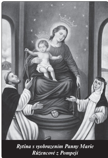
Rytina s vyobrazením Panny Marie Růžencové z Pompejí

„Kdysi jsem modlitbu růžence považovala za velice nudnou, ještě tak spíš pro starší lidi. To – jak jsem si tehdy myslela – »břebentění zdrávasků« mě rozčilovalo a nebyla jsem schopná se pomodlit ani jeden desátek. Když jsem se pustila do pompejské novény, neměla jsem s modlitbou růžence žádné problémy, přestala se mi zdát směšná a stala se mou oblíbenou modlitbou. Přesvědčila jsem se, že