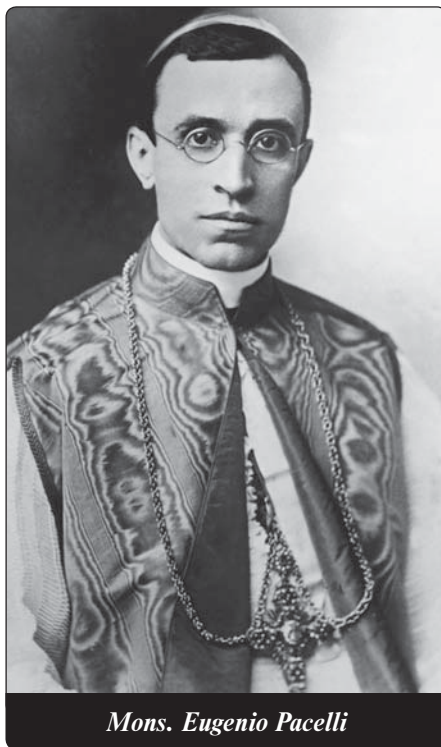
Mons. Eugenio Pacelli

Jenom o čtyři roky později uzavřel Pacelli také konkordát s převážně evangelickým Pruskem. Prelát Ludwig Kaas, předseda Frakce Centra , řekl: „Plán pruského konkordátu vypadal zpočátku skoro beznadějně.“ Podle Kaase to byla zásluha Pacelliho, jehož diplomatickou obratnost nemohl dost vynachválit. Ještě ve stejném roce 1929 následovalo Pacelliho odvolání do Říma, aby tam byl vyznamenán kardinálskou hodností a působil jako státní sekretář po boku Pia XI. ▶