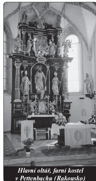
Hlavní oltář, farní kostel v Pettenbachu (Rakousko)

nosti,“ říká svatý Bonaventura. Krásné a povznášející jsou ornamenty a postoje odevzdanosti, bohopocty, jásetu a chvály, jakou představují andělé a svatí.