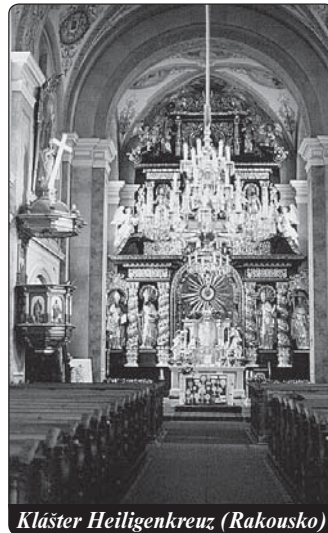
Kláster Heiligenkreuz (Rakousko)

Knihy nese titul „Barokní oltářní svatostánky“, protože svatostánek v baroku stál na tom nejčestnějším místě církevní budovy, totiž na menze hlavního oltáře v presbytáři, kam směřuje celý prostor chrámu. Ikonografická výzdoba, kterou zpravidla tvoří adorující andělé, vzácné materiály, detailní výzdoba a celá forma a architektura