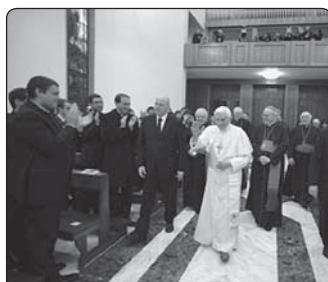
Papež Benedik XVI. na návštěvě římského semináře 4. 3. 2011

A teď udělejme krok dále: Za slovem povolání následuje rozměr církevní. Hovořili