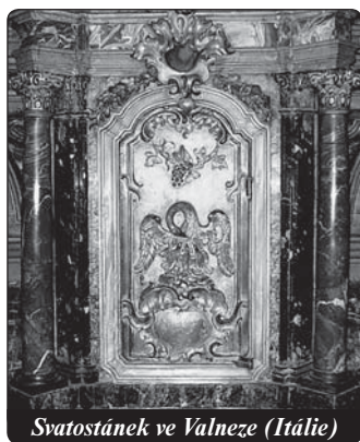
Svatostánek ve Valenze (Itálie)

Ujasnil jsem si, že Eucharistie je důležitým tématem v ekleziologickém dialogu. Je svátostí jednoty a souvisí s jinými svátostmi, především svěcením kněží. Bez jednoty interpretace Eucharistie není možná jednota církve. Proto je tak důležité, aby účastníci dialogu prostě neignorovali představy o tajemství Eucharistie. Je třeba pochopit, co katolická církev rozumí pod tajemstvím Eucharistie, totiž zpřítomnění Kristovy oběti na kříži na Kalvárii, bezvýhrad-