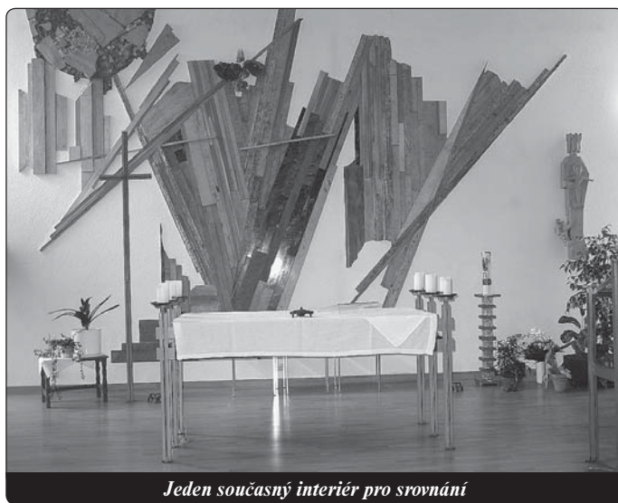
Jeden současný interiér pro srovnání

né zástupné sebevdání božského Vykupitele za nás, ztracené tvory, je to dar nového věčného života ve společenství s Kristem. Tridentský koncil, který vydal směrnicí pro výstavbu barokních oltářních svatostánků, prosazoval formulaci, že v Eucharistii je přítomno Tělo a Krev, duše a božství Ježíše Krista. Tuto skutečnost výslovně potvrdil Kristus na počátku 20. století svatá Faustyně Kowalské v souvislosti s naukou o Božím milosrdenství. Já jsem pro svůj osobní duchovní život mohl čerpat užitek z práce o Eucharistii teprve po svém osobním obrácení a novém uspořádání vlastního života podle církevních příkázání.