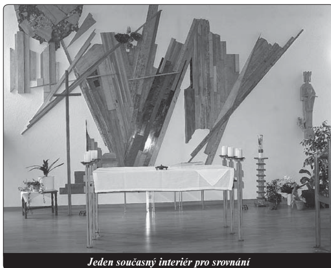
Jeden současný interiér pro srovnání

né zástupné sebevydání božského Vykupitele za nás, ztracené tvory, je to dar nového věčného života ve společenství s Kristem. Tridentýský koncil, který vydal směrnice pro výstavbu barokních oltářních svatostánků, prosazoval formulaci, že v Eucharistii je přítomno Tělo a Krev, duše a božství Ježíše Krista. Tuto skutečnost výslovně potvrdil Kristus na počátku 20. století svatě Faustyně Kowalské v souvislosti s naukou o Božím milosrdenství. Já jsem pro svůj osobní duchovní život mohl čerpat užitek z práce o Eucharistii teprve po svém osobním obrácení a novém uspořádání vlastního života podle církevních příkazání.