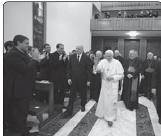
Papež Benedik XVI. na návštěvě římského semináře 4. 3. 2011

A teď udělejme krok dále: Za slovem povolání následuje rozměr církevní. Hovořili