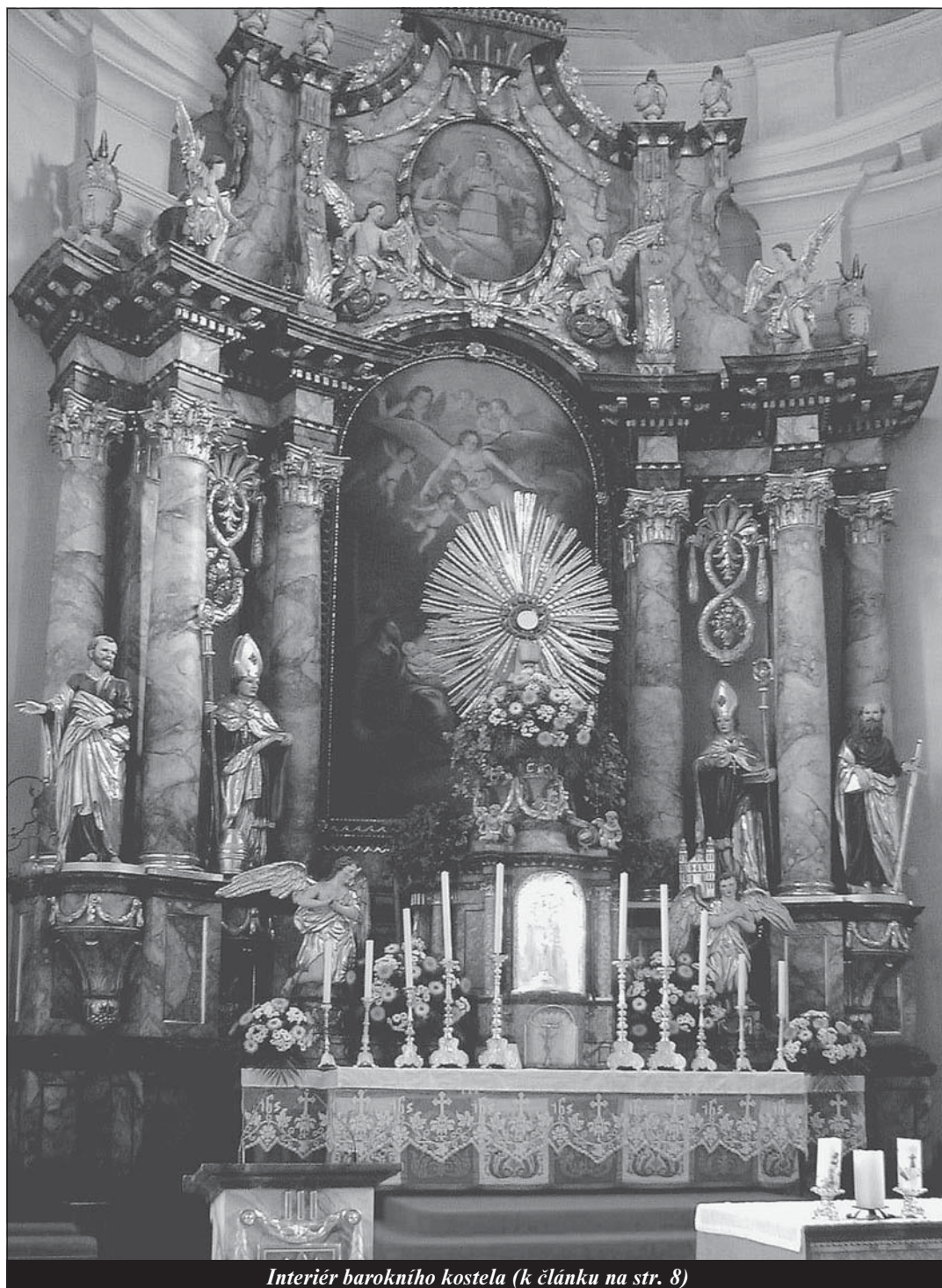
Interiér barokního kostela (k článku na str. 8)