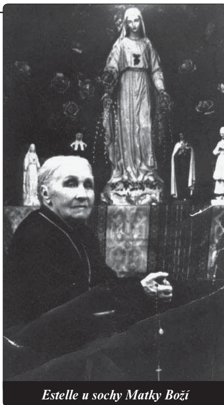
Estelle u sochy Matky Boží

Na tabuli byla napsána tato slova: „Ve své nejhlubší nouzi jsem volala Marii. Ona způsobila skrze svého Syna moje úplné uzdravení.“