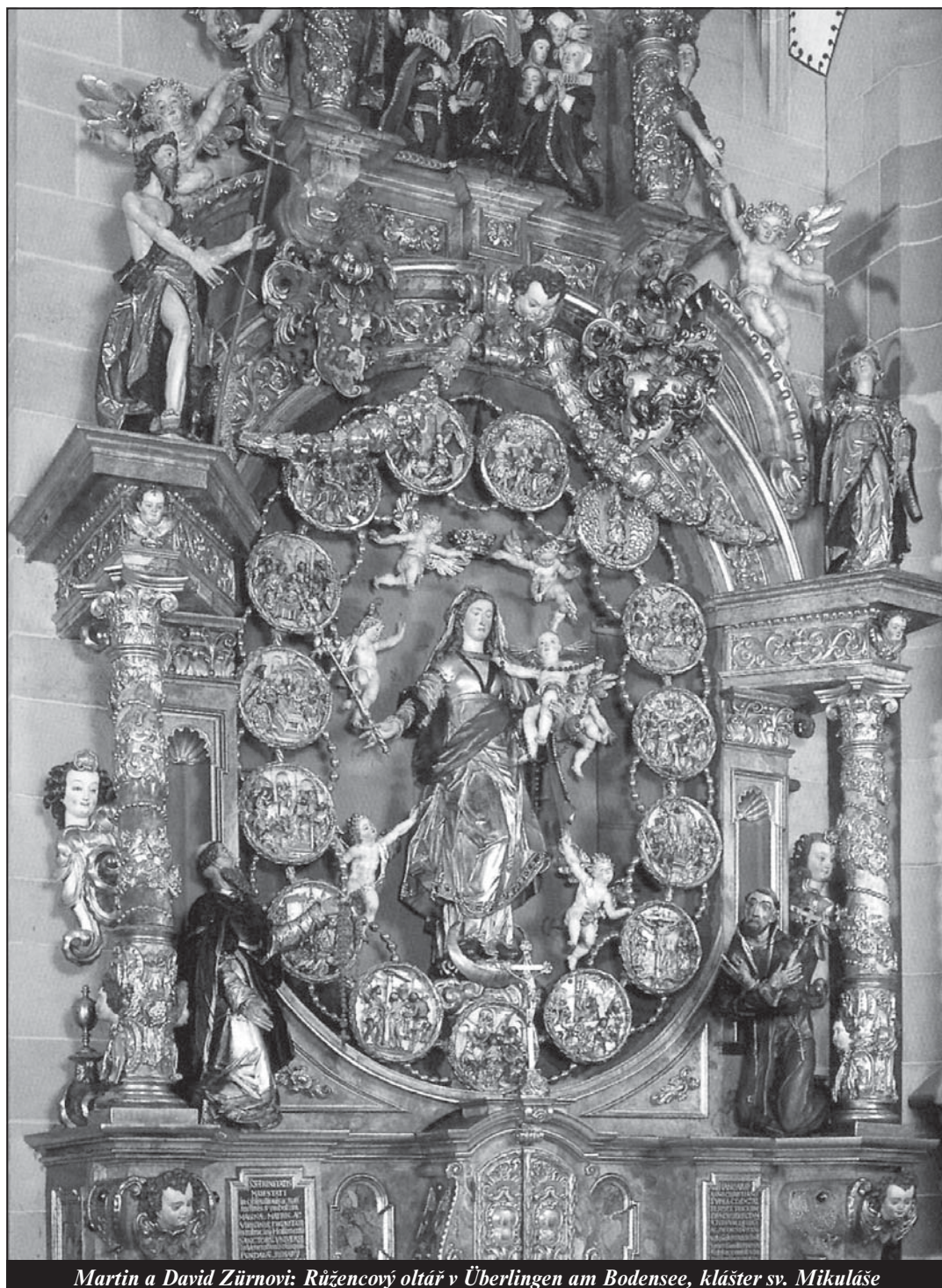
Martin a David Zürnovi: Rüzcenový oltář v Überlingen am Bodensee, klášter sv. Mikuláše