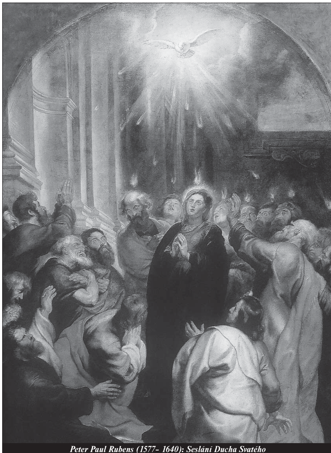
Peter Paul Rubens (1577- 1640): Seslání Ducha Svatého