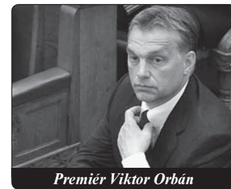
Premiér Viktor Orbán

Maďarská vláda pod vedením premiéra Viktora Orbána přijala přepracovanou ústavu. Její preambule začíná slovy: „Bůh žehnej Maďarsku.“ Hrdost Maďarů