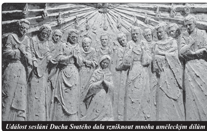
Událost seslání Ducha Svatého dala vzniknout mnoha uměleckým dílům