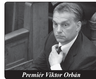
Premiér Viktor Orbán

Maďarská vláda pod vedením premiéra Viktora Orbána přijala přepracovanou ústavu. Její preambule začíná slovy: „Bůh žehnej Maďarsku.“ Hrdost Maďarů