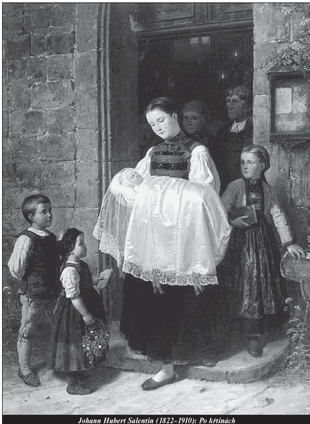
Johann Hubert Salentin (1822-1910): Po křtinách