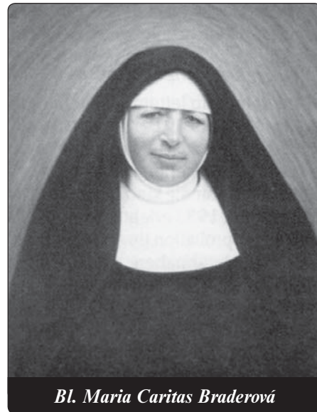
Bl. Maria Caritas Braderová

Nevznikl zde kontemplativní klášter jako filiálka Maria Hilf z Altstätten, nýbrž šlo o nové založení, s papežským dispensem, sestry byly nazvány Františkánské misijní sestry z Maria Hilf .