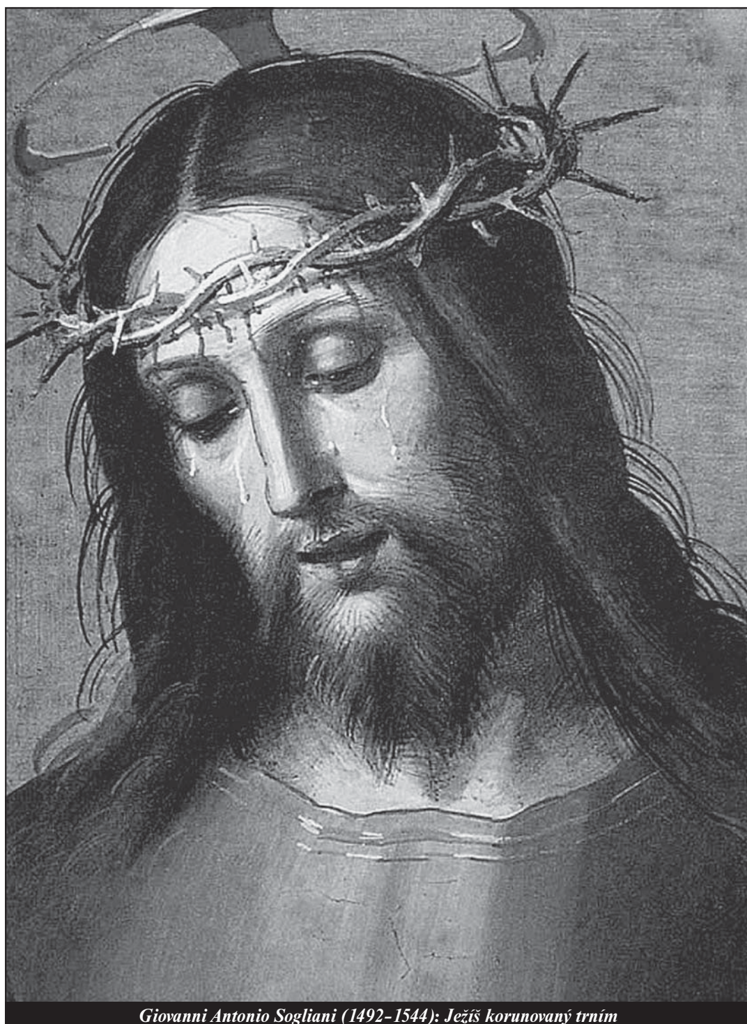
Giovanni Antonio Sogliani (1492-1544): Ježíš korunovaný trním