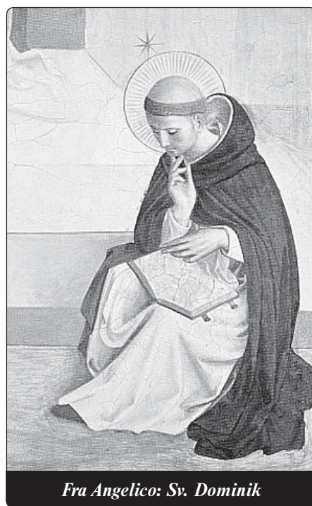
Fra Angelico: Sv. Dominik

Tohoto ušlechtilého dómského žáka z Palencie si Pán vyvolil za svého nejudatnějšího bojovníka v těžké době. Bludné učení katarů pustošilo země střední Evropy. Zvláště v jižní Francii, kde se příznivci katarů jmenovali také albigenští podle svého hlavního sídla v Albi, mátlí srdce lidí. Bosí, zahalení do bidného žebráckého oděvu, táhli kazatelé nové sekty od města k městu, od vesnice k vesnici, zamračení ve tváři, zamračené bylo jejich učení. Vykládali viditelný svět jako stvoření Zlého, popírali spasení Ježíšem Kristem, svátosti, popírali zmrtvýchvstání těla.