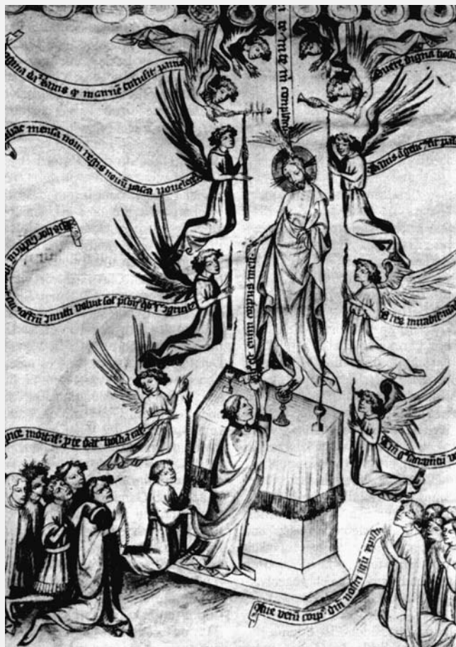
Detail ilustrace v evangeliáři z Mettenu z r. 1414: Proměňování

Svatý otec zdůrazňuje, že silou svého vnitřního vztahu k oběti na Golgotě je Eucharistie obětí ve vlastním slova smyslu. Jedná se nikoliv o pouhé sebeodevzdání Krista věřícím. Dar jeho lásky a jeho poslušnosti až k dokonání života je v první řadě „darem svému Otcí“. Papež upřesňuje, že je to přirozeně dar k našemu blahu, pro celé lidstvo, ale je to především dar Otcí, „oběť, kterou Otec přijal, a tak opětoval bezmeznou oddanost svého Syna, který se stal poslušný až k smrti, svou otcovskou oddaností, to znamená věčným životem ve zmrtvýchvstání“ (enc. RH 20).