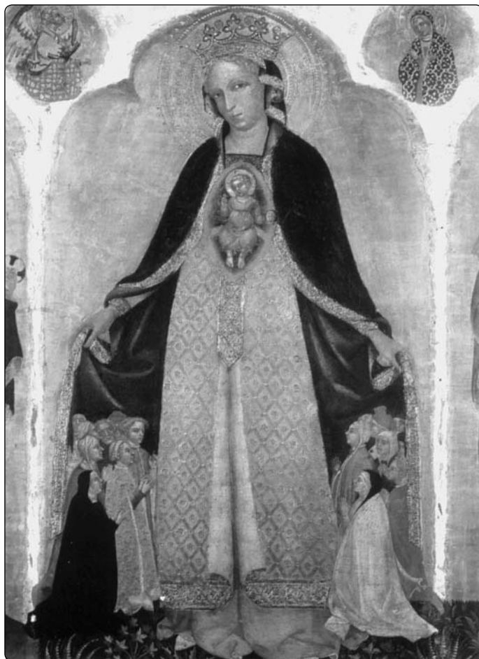
Jacobello (1394-1439): Matka milosrdenství, Benátky

Žádná přímluva svatých včetně Panny Marie nemá větší působnost, než jakou jí uděluje Bůh. Posledním cílem přímluvy není změnit Boží vůli, nýbrž naplnit ji. Proto nejvíce účinná je ta přímluva, která, pokud jde o lidstvo, sleduje nejdokonalejším způsobem Boží vůli. Vedle modlitby Ježíšovy je nejdokonalejší modlitbou modlitba svaté Panny, která vždy nejdokonaleji ze všech tvorů naplňovala Boží vůli. Pro-