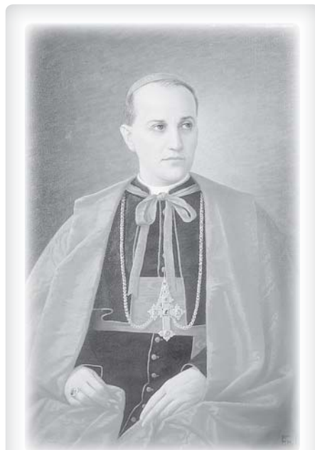
Blahoslavený Aloysius Viktor Stepinač (1898–1960)

V létě 1931 se vrátil do své chorvatské vlasti a stal se ceremoniářem arcibiskupa Antona Bauera, byl takřka jeho pravou rukou. Aby se účinně postavil proti stále rostoucím obtížím rychle se zvyšujícího počtu záhřebského obyvatelstva, uvedl arcibiskup na naléhání svého ceremoniáře do života Charitu arcidiecéze Záhřeb. Zvláštní pozornost věnoval Stepinač problémům studentů. Od 10. dubna 1934 byl nositelem titulu „notář duchovní rady arcidiecéze“. A potom ho překvapilo nečekané rozhodnutí jeho arcibiskupa: „Aloysi! Budete mým koadjutorem a následovníkem!“ Veškeré zdráhání vyvolenému nepomohlo, a ve věku pouhých 36 let, jen 4 roky po kněžském svěcení, se Stepinač ujal svého zodpovědného úkolu. „Uklidněte se! Ten nedostatek, že jste příliš mladý, se bude každým dnem zmenšovat!“ Tak ho uklidňoval nuncius Msgr. Pellegrinetti. Dne 24. června 1934 následovalo biskupské svěcení.