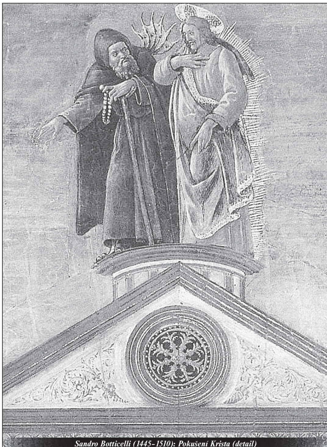
Sandro Botticelli (1445-1510): Pokušení Krista (detail)