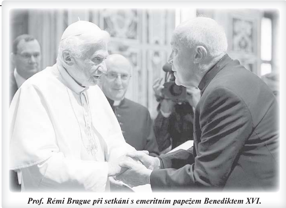
Prof. Rémi Brague při setkání s emeritním papežem Benediktem XVI.

„Pokud nedokážeme legitimizovat člověka, podat platné důvody jeho bytí jako takového, nebudeme mít důvod, proč dál existovat. Zbývala by jen možnost organizovat soužití těch, kdo tady už jsou, a zároveň si zakázat vztah k budoucím generacím, kterých se nemůžeme zeptat na názor. Budoucnost lidstva by v žádném případě nesměla být ponechána na instinktu, jak to činí někteří, protože už jsme schopni rozhodovat, zda tu příští generace budou či nikoliv. Instinkt fungoval jako to, díky čemu