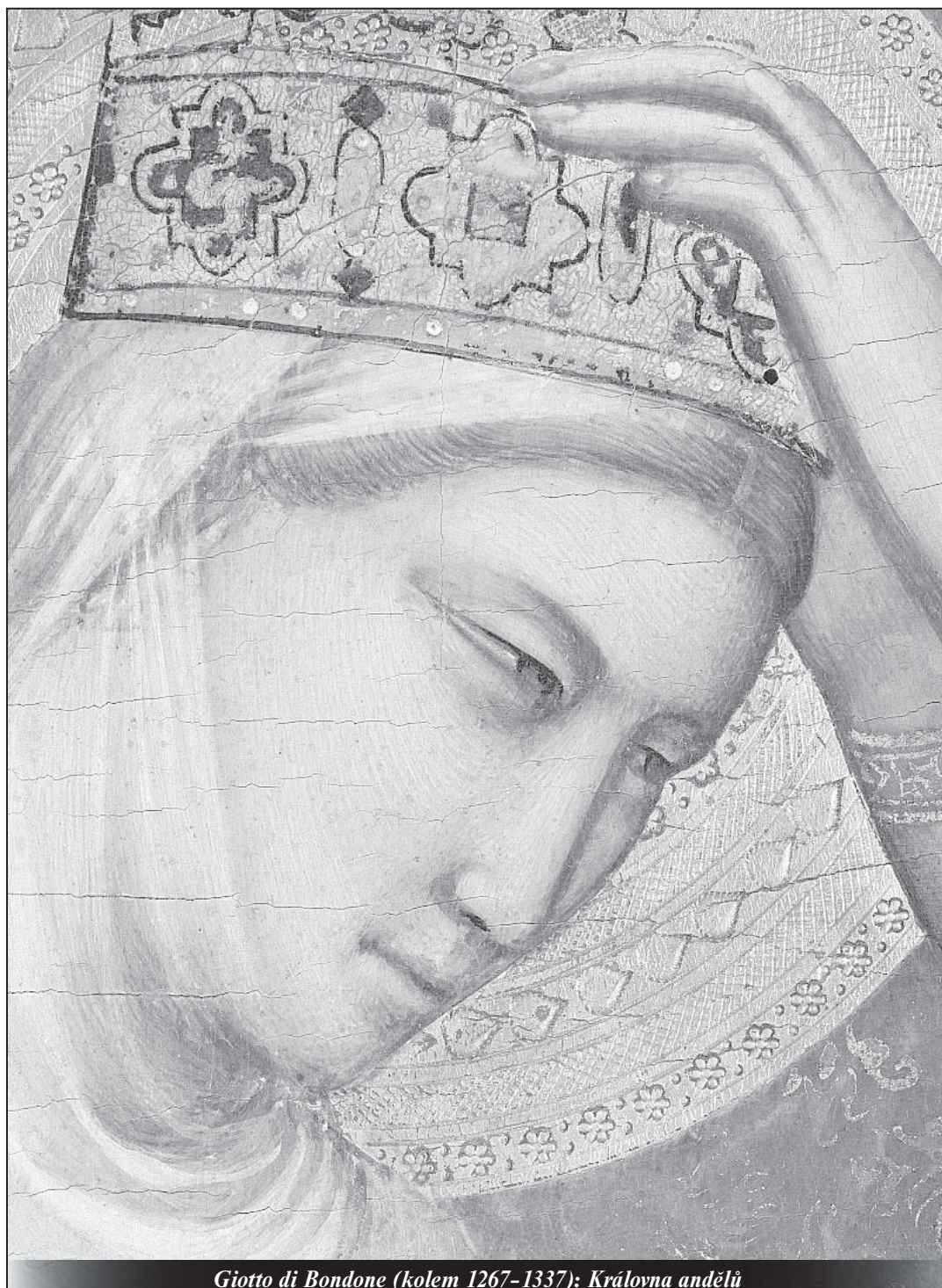
Giotto di Bondone (kolem 1267-1337): Královna andělů

Jsou děti z rodin a homosvazků opravdu stejně? - strana 13 -