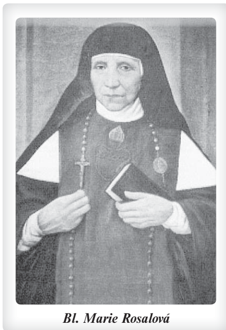
Bl. Marie Rosalová

Sestra Marie žila zdánlivě obyčejně – horlivě svými skutky naplňovala charisma kongregace, věnovala svou péči všem potřebným, mezi něž rozsévala zrnka víry v Krista Ježíše. Vycházela přitom z plné odevzdanosti Spasiteli a důvěrných rozhovorů s Ním, v nichž čerpala sílu ke svému bohublému počínání. Ponoření se do