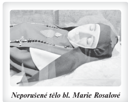
Neporušené tělo bl. Marie Rosalové

Dne 24. srpna 1886 při jízdě na koni z kláštera v Tulcánu do baziliky Las Lajas v Otavalu spadla ze sedla, a to tak nešťastně, že se zranění ukázalo jako smrtelné. Její pohřeb v Tulcánu trval tři dny. Když byl v roce 1970 hrob této řeholnice otevřen pro účely exhumace