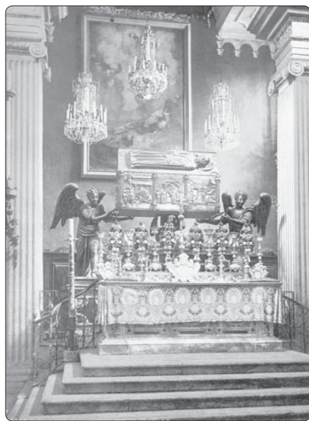
Stříbrná schránka s ostatky sv. Simeona má dnes místo nad hlavním oltářem kostela sv. Simeona v Zadaru. Je nejcennějším dílem středověkého zlatnického umění Chorvatska. (Fotografie z roku 1900)

ry, ale ještě stále toužila po synovi – následníku trůnu, chtěla získat relikvii světce. Když se v úpěnlivé modlitbě za dar syna sklonila nad otevřený sarkofág s tělem proroka Simeona, podařilo se jí nenápadně odломit jeden z jeho prstů. Jako zlodějka si schovala relikvii do výstřihu svých šatů, ale hned s hrůzou spatřila ránu, která se jí v tom okamžiku vytvořila na hrudníku. Vylekaná královna se z ničeho nic ocitla uprostřed svého doprovodu a musela čelit zvědavým otázkám