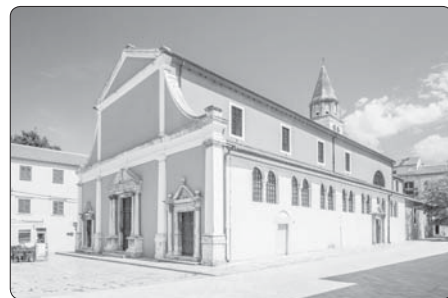
Kostel sv. Simeona v Zadaru

po původu zranění. Hluboce zahanbená ukradený prst vrátila a přislíbila, že jako zadostiučinění a z úcty k sv. Simeonovi mu dá zhotovit vzácnou schránku. V roce 1377 pověřila tímto úkolem italského zlatníka z Milána, který působil v Zadaru. Darovala mu nejen 240 kg stříbra a značné množství zlata, ale tato kající královna nechala na stříbrný reliéf dokonce zvětšit zahanbující scénu s neporušeným tělem světce.