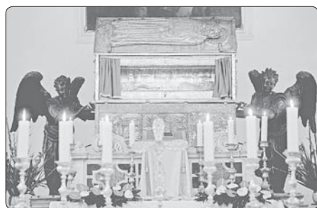
Schránka s ostatky sv. Simeona dnes