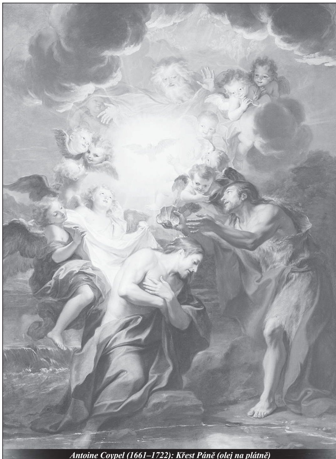
Antoine Coypel (1661–1722): Křest Páně (olej na plátně)