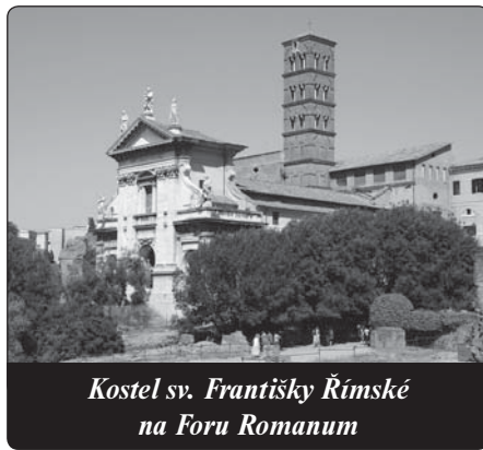
Kostel sv. Františky Římské na Foru Romanum

Františka byla Lorenzovi věrnou a obětavou manželkou, darovala mu šest dětí. Její domácnost a výchova potomků jí poskytovaly ale stále dost času na Boha