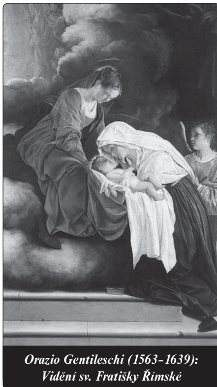
Orazio Gentileschi (1563–1639): Vidění sv. Fratišky Římské