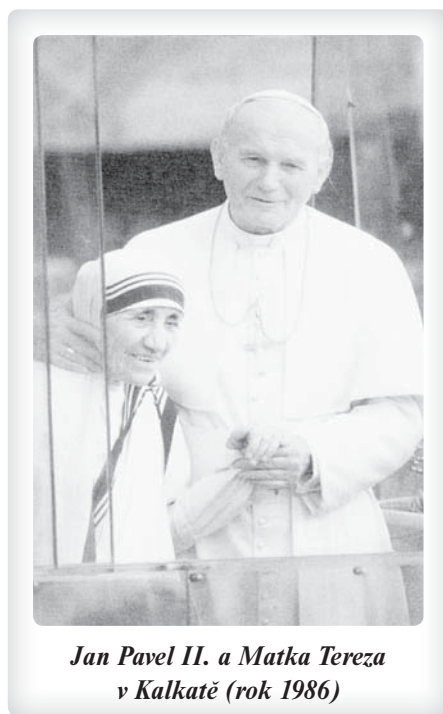
Jan Pavel II. a Matka Tereza v Kalkatě (rok 1986)