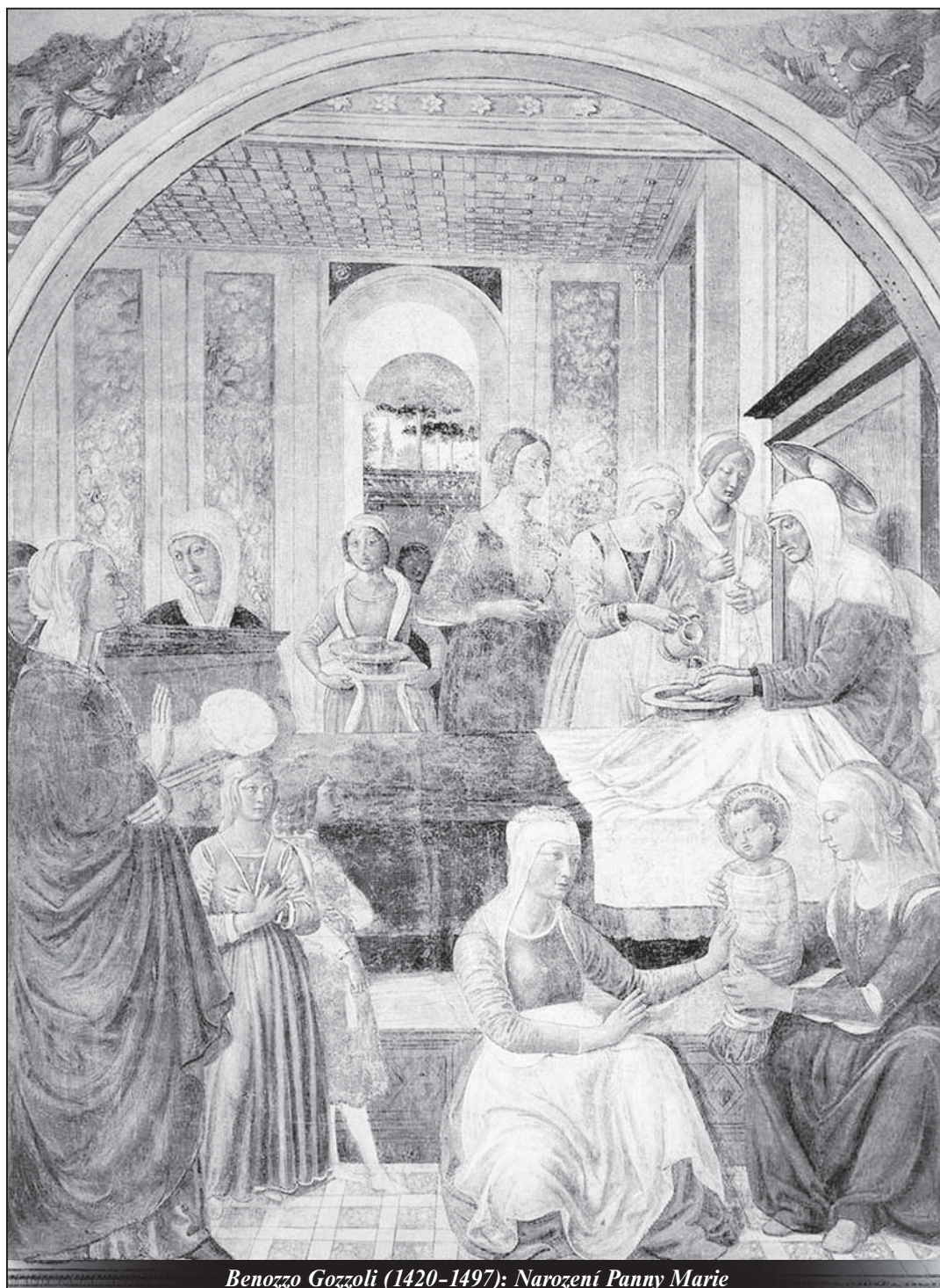
Benozzo Gozzoli (1420–1497): Narození Panny Marie

Papež zakročil proti belgické řeholi schvalující eutanzii - strana 13 -