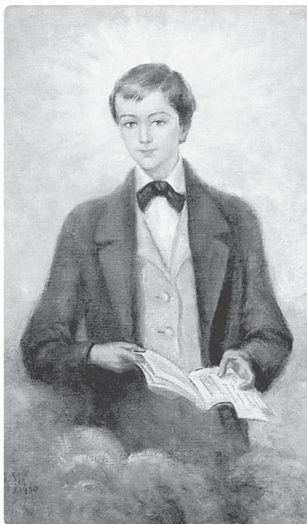
Svatý Dominik Savio

Dominik Savio se přiblížil o pár kroků a zůstal přede mnou stát. Jeho šaty byly zvláštní. Bílá tunika protkaná diamanty splývala až k patám. Široký rudý pás hustě vyzdobený drahokamy mu obepínal boky. Na krku mu visely věnce nevidaných, podivuhodných květů, které zářily nadzemským světlem. Na hlavě měl jako korunu věnec z růží. Kadeře mu vlnitě splývaly přes ramena a dodávaly mu tak krásný, půvabný a přitažlivý vzhled, že se zdálo, jako by byl andělem. Také