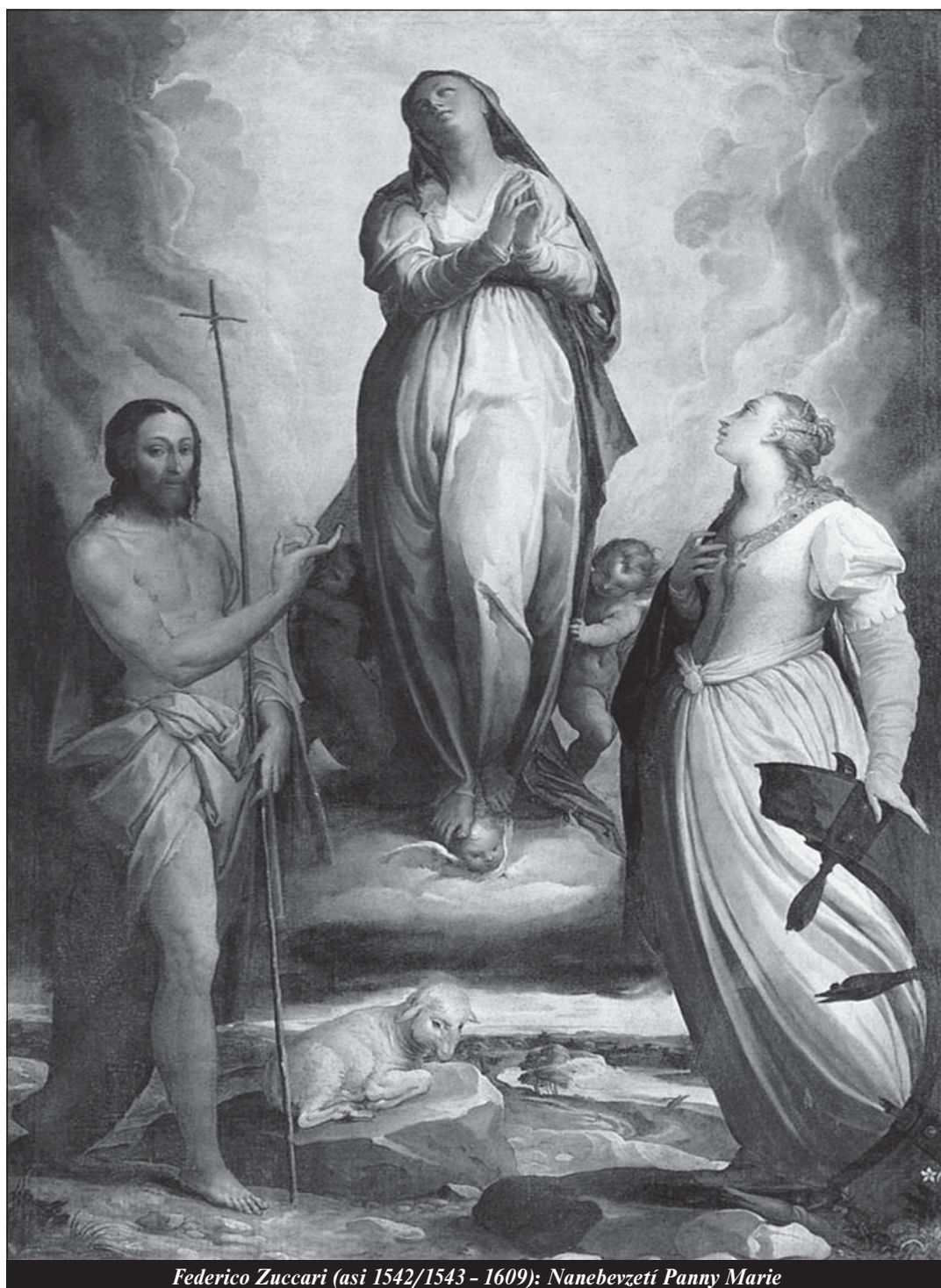
Federico Zuccari (asi 1542/1543 - 1609): Nanebevzetí Panny Marie