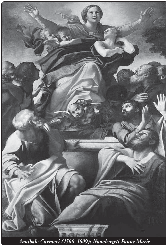
Annibale Carracci (1560-1609): Nanebevzetí Panny Marie

Nanebevzetí je nejšťastnější konec pozemského života a nejšťastnější počátek života v nebi, kdy duše i tělo Blahoslavené jsou v plné jednotě s nejvyšším Dobrem. Je to tedy také mateřské pozvání duším, aby se velkodušně odpoutaly od pozemských věcí a falešného dobra a směřovaly k věcem nebeským, k pravé jednotě s Bohem, nejvyšším