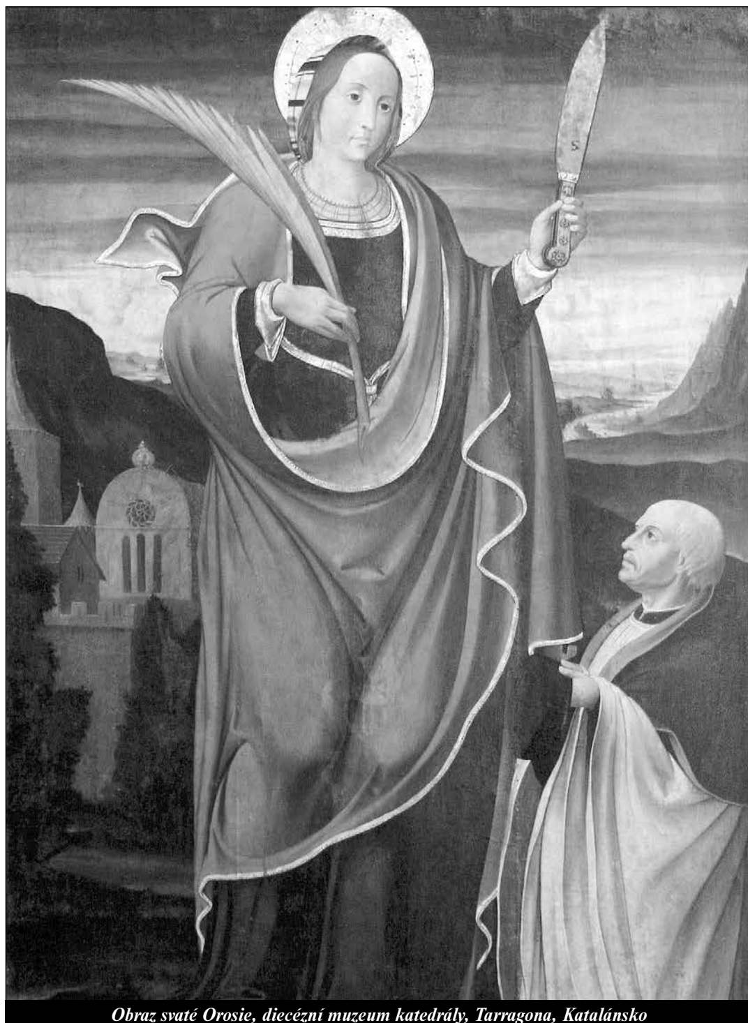
Obraz svaté Orosie, diecézní muzeum katedrály, Tarragona, Katalánsko