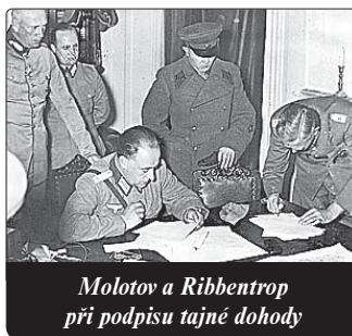
Molotov a Ribbentrop při podpisu tajné dohody

Velké evropské mocnosti Anglie a Francie, které netečně přihlížely anšlusu Rakouska a invazi do Československa, nejdříve na území Sudet a pak do Čech a na Moravu v březnu 1939,