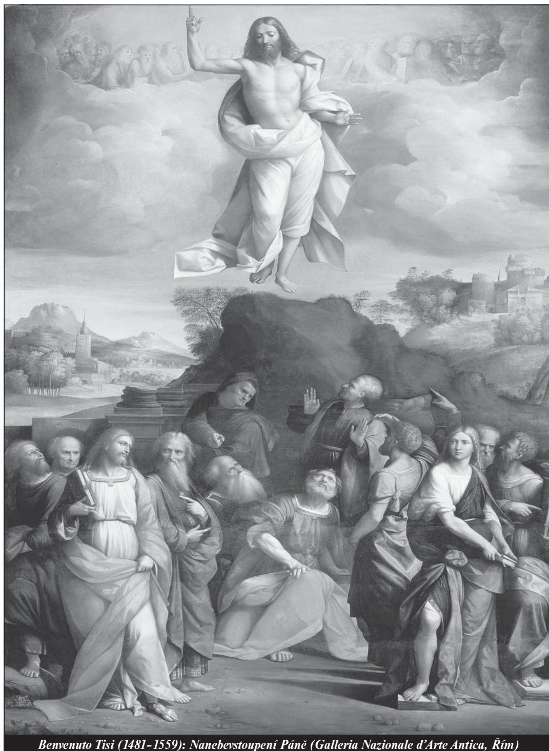
Benvenuto Tisi (1481-1559): Nanebevstoupení Páně (Galleria Nazionale d'Arte Antica, Řím)