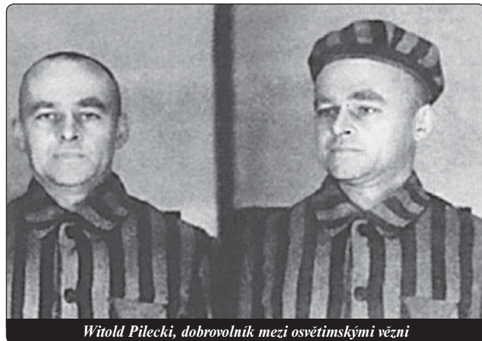
Witold Pilecki, dobrovolník mezi osvětimskými vězni

Navíc byl odsouzen k vymazání z paměti , protože se stal pro všechny nepohodným svědkem. Pilecki dosvědčoval, že světové mocnosti věděly velmi dobře, co se děje v Osvětimi. Věděly, a vůbec nereagovaly. Ve zmíněném poselství Jan Pavel II. říká: „Je třeba pamatovat na ty, kteří byli zabiti polskými institucemi a bezpečnostními orgány, pracujícími ve službách systému vnučeného z Východu. Je třeba