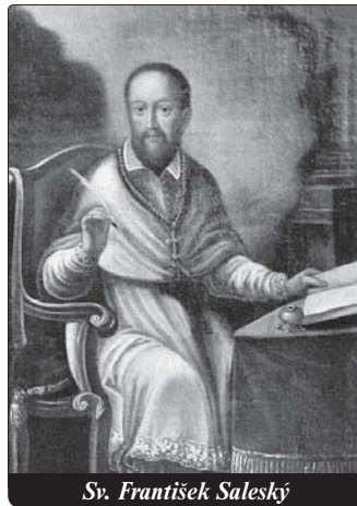
Sv. František Saleský

světější Svátost opět přenesena do kostela svatého Augustina. Byl to skutečný triumf víry celého kraje.