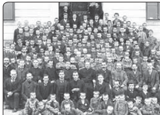
Don Bronislav Markiewicz se svými spolupracovníky a svěření