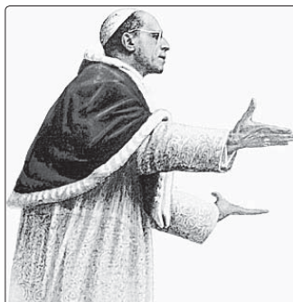
Papež Pius XII.