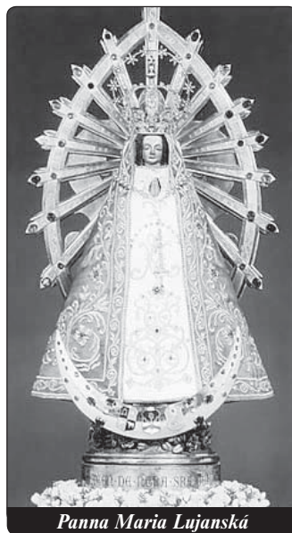
Panna Maria Lujanská

A by znovu probudil víru okolního obyvatelstva, chtěl Portugalec, vlastník rozsáhlého teritoria (Sumampa – Santiago del Estero) v argentinském státě Rio de la Plata, vzdáleného 1200 km od Buenos Aires, postavit na svém území kapli zasvěcenou Panně Marii. Prosil tedy svého krajana v Sao Paulo v Brazílii, aby mu poslal sochu Panny Marie. Ten však nevěděl, v jaké podobě by měla být Matka Boží představena, a proto mu poslal sochy dvě, jednu s Ježíškem v náručí a jednu Neposkvrněného Početí. Po cestě na moři byly sochy naloženy na vůz v konvoji, který se měl vydat na dalekou cestu.