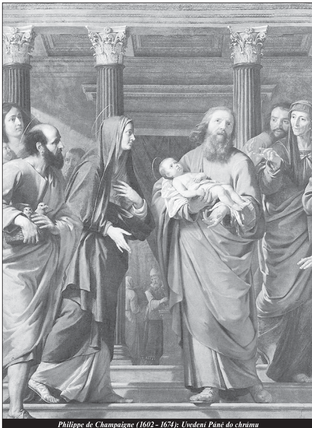
Philippe de Champaigne (1602 - 1674): Uvedení Páně do chrámu

Nemlčte k vraždění nigerijských křesťanů, naléhá tamní kněz - strana 13 -