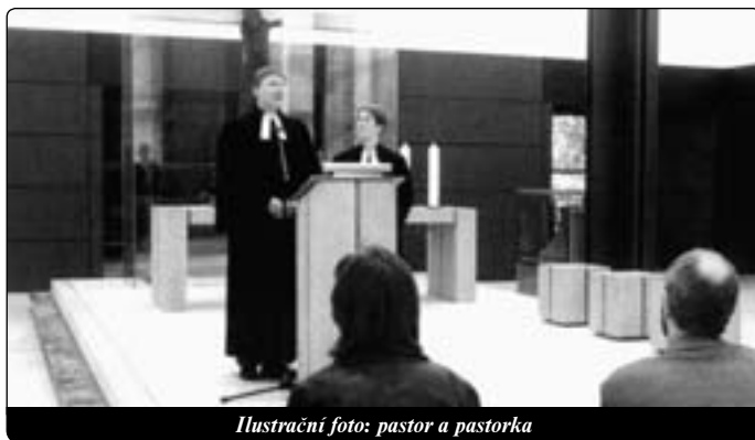
Ilustrační foto: pastor a pastorka

Jako luteránka jsem neměla žádný vzor ženské svatosti, který by byl pro mě určující a který by mi mohl poskytovat útěchu. I když mnoho protestantských vyznání světilo ženy, neuznávají význam ženství, mateřství Církve, tak jak je ztělesněno v Marii a v Božím plánu spásy. Nechápu, proč tolik katolíček má výhrady k řeholním sestrám v životě Církve, jako by to byly občanky druhé kategorie. Ony jsou duchovními matkami. Protestanti ženám nikdy takovou roli nepřiznali. Navíc je zde mno-