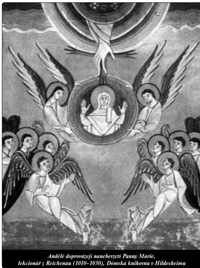
Andělé doprovázejí nanebevzetí Panny Marie, lekcionář z Reichenau (1010–1030), Dómská knihovna v Hildesheimu

Svou povahou jsou mocní a velicí, ale ještě mocnější a větší je jejich nadpřirozená povaha. Jsou nejen duchové, to je jejich přirozenost, ale jsou to také duchové naplnění Duchem Svatým – to je jejich nadpřirozená povaha. Jsou zapojeni do