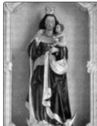
Panna Maria z Gräfinthalu

Bez pochybování splnila Maria roli, kterou jí Bůh přidelil jeho zrozením, při návštěvě pas-