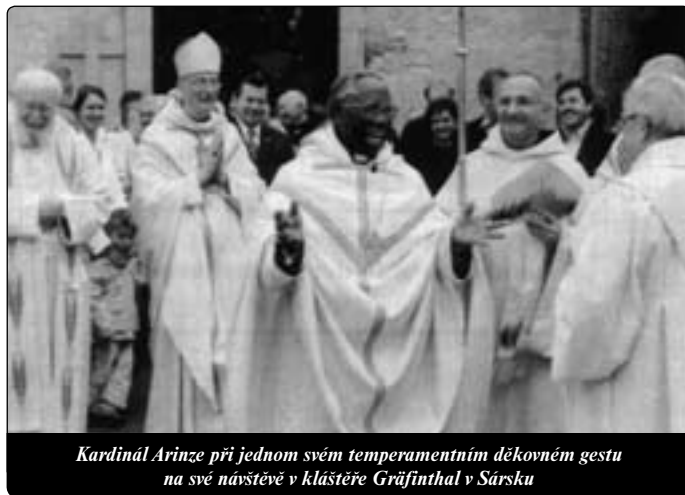
Kardinál Arinze při jednom svém temperamentním děkovném gestu na své návštěvě v klášteře Gräfinthal v Sársku

Prosíme naši blahoslavenou Pannu, abychom obdrželi hlubokou víru v Boží prozřetelnost a větší ochotu plnit Boží vůli. Pro každého z nás je viditelná nejprve v povinnostech našeho stavu, ať už jako manželů anebo samostatného věřícího, jako kněze či Bohu zasvěcené řeholní osoby. Stáváme se svatými především hlubokou vírou, která se projevuje ve věrnosti v maličkostech každodenního života. Poznáváme Boží vůli také