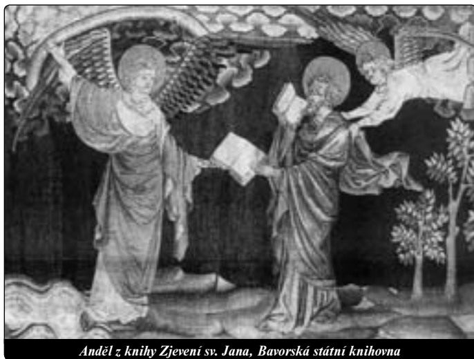
Anděl z knihy Zjevení sv. Jana, Bavorská státní knihovna

Když slavíme mši svatou, myslíme na to, že andělé jsou