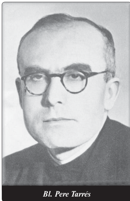
Bl. Pere Tarrés

Petr měl brzy velký zástup pacientů. Navzdory mnoha bezplatným ošetřením, která poskytoval chudým tohoto měs- ta, vydělával velmi dobře a mohl si brzy koupit pěkné auto. „O svých pacientech uvažuji v první řadě jako o přátelích,“ ří- kal náš doktor. „Pro mě stojí lékař před nemocným jako kněz před oltářem. Po- stel je oltář. Pacient je trpící oběť. Lékař je kněz. Nenapadlo vás to nikdy, když jste stáli u nemocného?“ ptal se někdy svých kolegů. Jeho přítomnost působila i na pacienty s nejvážnějším onemocně- ním uklidňujícím dojmem. Později řekl: „Během celé své praxe jsem dělal všech- no možné, aby nemocní mohli přijmout svátosti. Smrt je okamžikem, kdy se mi- losrdenství Boží vznáší nad duší a lékař může pomoci, navést je na správnou drá- hu. Zažil jsem skutečně útešné případy.“ Jeho soucit s pacienty byl bez hranic. Tak