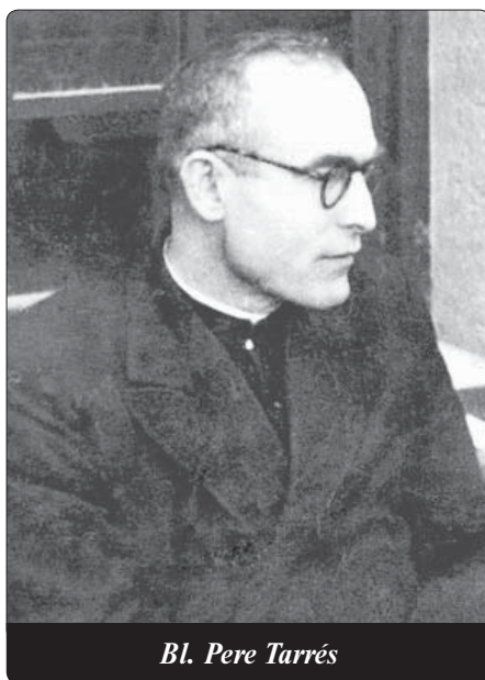
Bl. Pere Tarrés