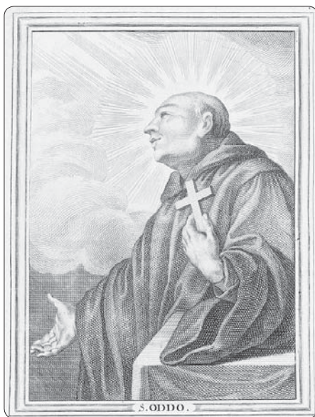
Sv. Odo z Cluny

Sám Odo zůstal jednou zázračně nedotčen bandou loupežníků, kteří se jej chystali přepadnout během jeho putování lesem. Odo si jich všiml a v důvěře v Boží Prozřetelnost nerušeně pokračoval dál za zpěvu žalmů. Vůdce loupežníků své muže zastavil s tím, že nemají šanci porazit takto početný oddíl ozbrojenců a ještě takto vyzbrojených. Když však ostatní loupežníci přesto chtěli na Oda ozbrojeného jen vírou v Boha zaútočit, jejich vůdce jim v tom zabránil se slovy, že dokud on bude na živu, nedovolí jim to. Odo prošel, aniž by mu kdokoli zkrivil vlasek na hlavě. Onen vůdce loupežníků se obrátil a později se stal clunyjským mnichem.