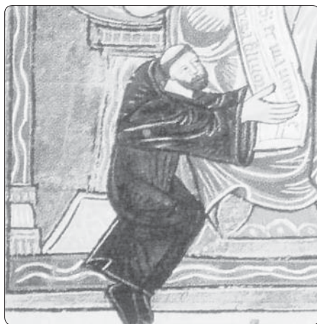
Kodex z 11. století, miniatura s vyobrazením sv. Oda z Cluny

Vzdal se svého výhodného postavení, po němž kolikrát marně vzhlíželi mnozí jiní, a odešel do benediktinského kláštera v dnešním Baume-les-Messieurs, kde byl opatem proslulý Berno, jehož jméno bylo s úctou v hlase spojováno se zbožností, již není nikde rovno. Baume bylo malým ostrůvkem opravdového následování Krista, jeho mniši žili pod Bernovým vedením přímo vzorně, na rozdíl od jiných klášterů, kde si podávaly ruku nevázanost s duchovní pustinou. I z toho je vidět, že