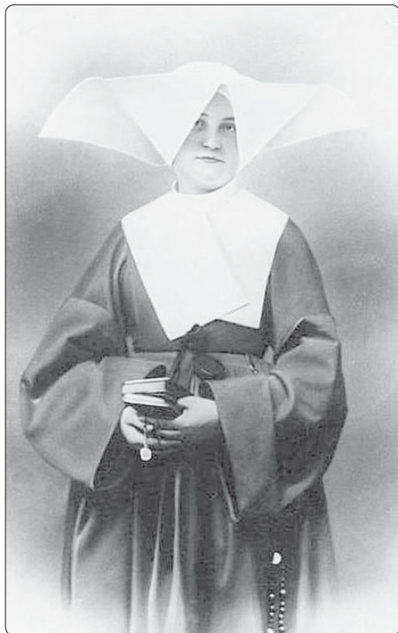
Blahoslavená Marta Wiecka

Rodičům napsala: „ Co se mne týče, nejsem s to vyjádřit, jak jsem šťastná. Tolik bych Vám to, rodiče moji milovaní, toužila alespoň několika slovy popsat, ale kdo může obsáhnout to štěstí, větší než cokoliv jiného na světě, že se může spojovat se Snoubencem? Snad postačí těchto pár mých slov: Můj Milý je můj a já jsem Jeho. Kéž bych se s Ním co nejdříve mohla spojit v nebi. “