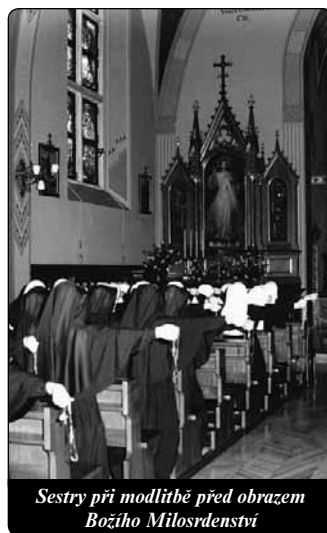
Sestry při modlitbě před obrazem Božího Milosrdenství

Proč Ježíš stanul před Faustynou tak, a ne jinak? Proč či-