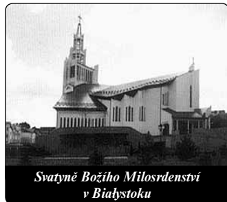
Svatyně Božího Milosrdenství v Białystoku

B líží se 15. únor. Zde v Białystoku je to důležité, všem známé datum. Alespoň takový mám dojem. Białystok je přece Městem Milosrdenství. Když se mluví o Božím Milosrdenství, ne-