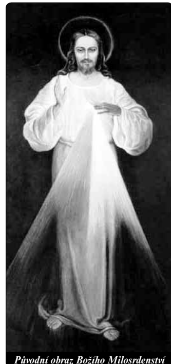
Původní obraz Božího Milosrdenství

ni právě taková gesta, a ne jiná? Chtěl být namalován právě tak. Proto také každá podrobnost tohoto obrazu má svůj význam. A zvláště toho obrazu, při jehož