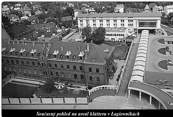
Současný pohled na areál kláštera v Łagiewnikach

lanými kněžími, aniž by uváděl konkrétně, o koho se jedná. Modlil se a hledal u Boha vnutnutí, jak postupovat. Nevyptával se na podrobnosti a nedával na jeho přílišný zájem o její předpovědi. Udržoval v sestře zájem tyto jevy zapisovat. Na druhé straně připravoval sestru na přijetí možných pokoreň, pronásledování a utrpení. Právě jimi se projevuje to, co prožívá. Pravá Boží díla narážejí na obtíže spojené s utrpením. Proto ji nabádal k trpělivosti a důvěře, protože chce-li Bůh něco vykonat, učiní tak později i navzdory všem obtížím a utrpením (D 270). Posiloval v ní postoj věrnosti k Božím vnutnutím, rozptyloval pochybnosti a povzbuzoval k starostlivosti o plnění Boží vůle.