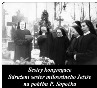
Sestry kongregace Sdružení sester milosrdného Ježíše na pohřbu P. Sopočka

Při svých analýzách zjistil, že v obsahu zjevení není nic, co by odporovalo víře nebo dobrým mravům. Naopak, zjistil, že tato řeholnice bez teologického vzdělání mluví velice zasvěceně o pravdách víry, takže ne jeden teolog by nedokázal vyjádřit výstižněji to, co se vztahovalo k Božím dokonalostem a především k Božimu Milosrdenství a potřebě její zvláštní úcty v druhou neděli velikonoční. Tuto její intuici nebylo podle jeho názoru možno vysvětlit jinak než nadpřirozeným osvícením jejího rozumu.