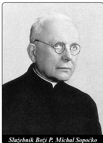
Služebník Boží P. Michal Sopočko

na setkání s tímto knězem předem pečlivě připravena. Bůh mi ho dal nejdřív vnitřně poznat, než jsem přijela do Vilna. (D 34) Na jiném místě napsala: Ježíšova