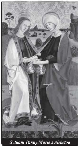
Setkání Panny Marie s Alžbětou

teřskou starostlivostí, prokázanou na svatbě v Káně Galilejské, jako by nám říkala: „Neváhejte a důvěřujte slovu mého Syna: On byl s to proměnit vodu ve víno, a je také stejně schopn učinit z chleba a vína své tělo a krev, a odevzdat