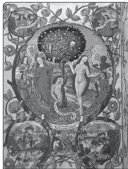
Berthold Furtmeyer: Pokrm smrti a pokrm nesmrtnosti, Salcburský misál