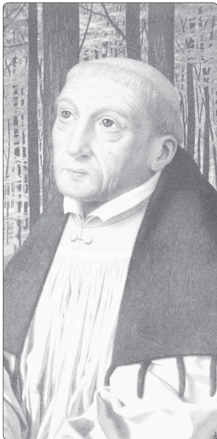
Blahoslavený Jan Ruysbroeck