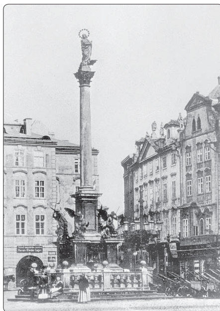
Mariánský sloup na Staroměstském náměstí v Praze

Modlitební liga císaře Karla I. za mír mezi národy se vyjádřila k úsilí bl. Karla I. takto: „Dovolte dodat, že ve stém výročí roku a měsíců, v nichž se blahoslavený Karel Rakouský, náš poslední císař a král, snažil co nejrychleji ukončit Velkou válku, a kdy svým rozhodnutím ze 16. 10. 1918 vytvořil z Rakousko-Uherska federativní soustátí, mu Modlitební liga vyjadřuje uznání a úctu, hodnou osobní podpory.“