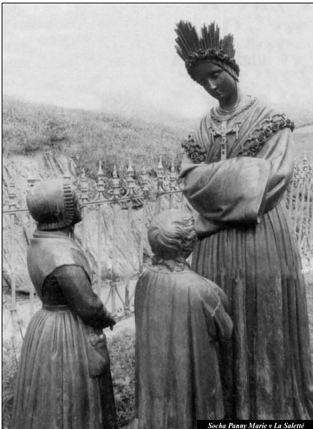
Socha Panny Marie v La Salettě