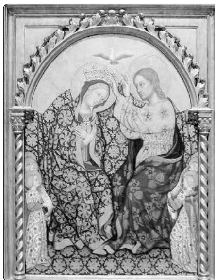
Gentile da Fabriano (kolem 1370-1427): Koronovace Panny Marie

Vládnout - to je úsilí velkých duší, podnět ke statečným dílům. Avšak existují dva