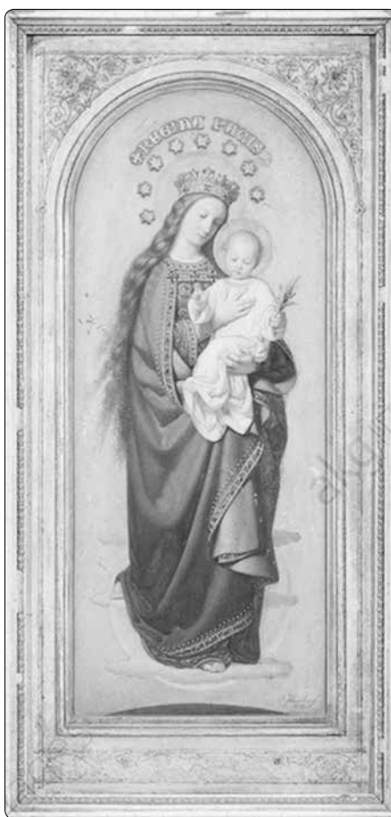
Franz Ittenbach (1813–1879): Regina Pacis

Pokoj s naším bližním znamená jednotu smýšlení a citů, která ruší veškerý nesoulad, žárlivost a hněv a odstraňuje veškeré spory a roztržky. Tato harmonie není ničím jiným než výsledkem té velké lásky, kterou Panna Maria přinesla na svět skrze svého Syna a které nás učila svým při-