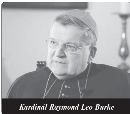
Kardinál Raymond Leo Burke