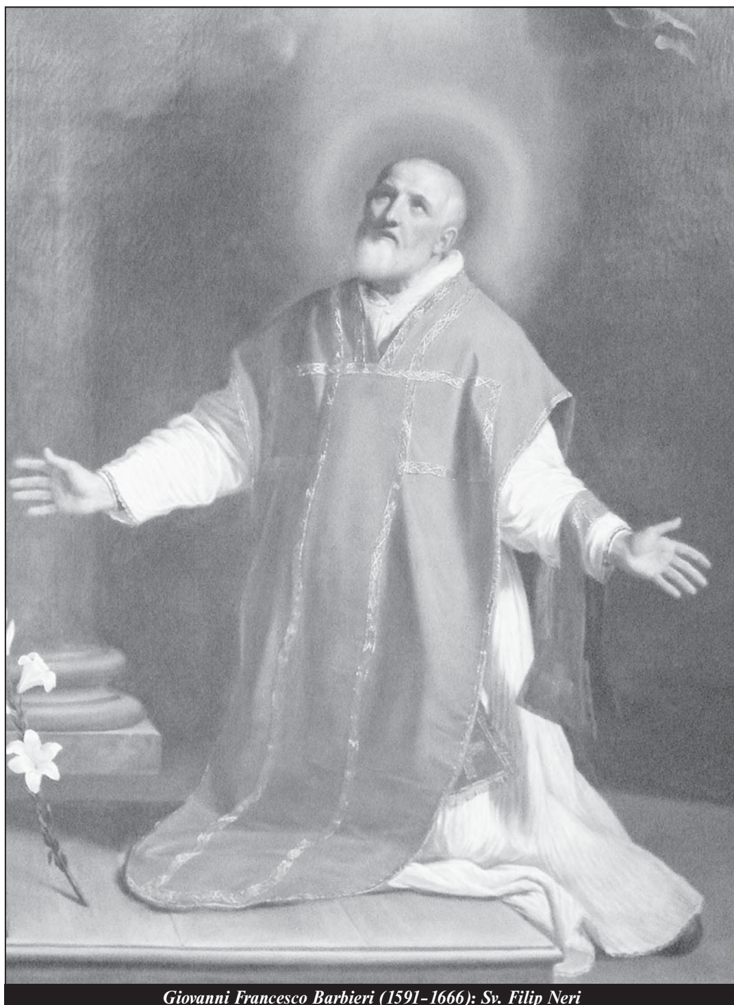
Giovanni Francesco Barbieri (1591-1666): Sv. Filip Neri

Moc má Ježíš a jeho evangelium Odpověď kardinála Raymonda Lea Burkeho na kritiku jeho osoby - strana 12 -