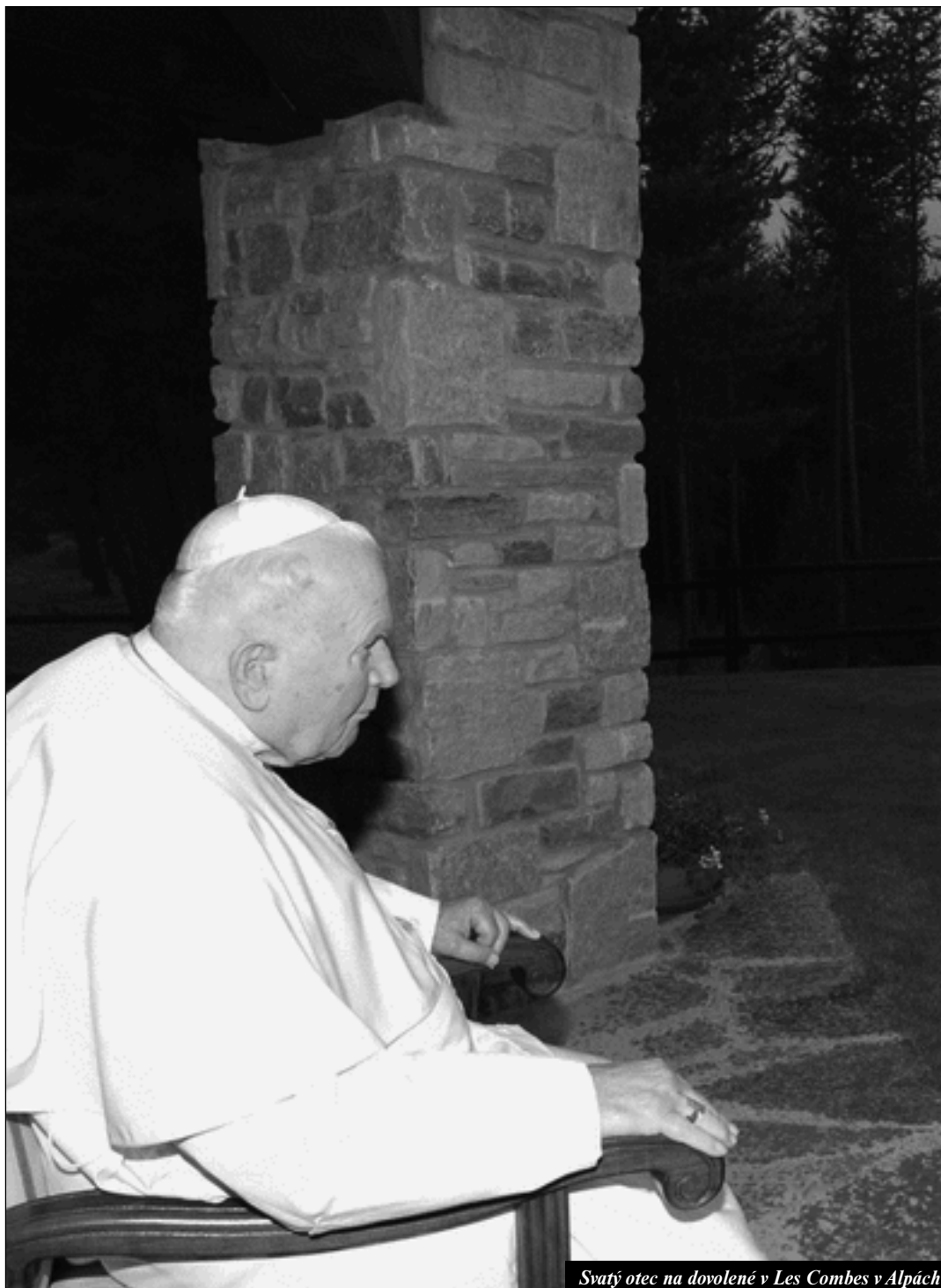
Svatý otec na dovolené v Les Combes v Alpách

Církev a antisemitismus (1) Grzegorz Kucharczyk - strana 12 -