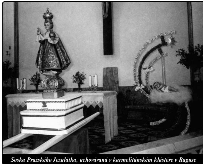
Soška Pražského Jezulátka, uchovávaná v karmelitánském klášteře v Raguse