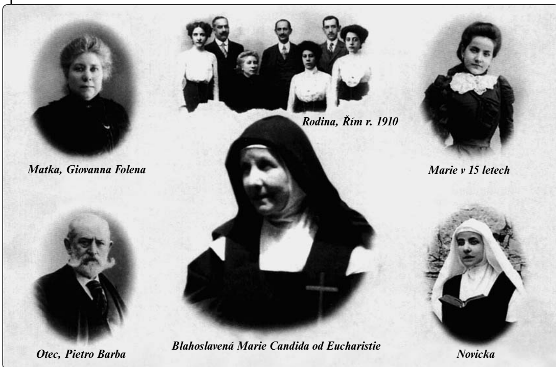
Rodina, Řím r. 1910