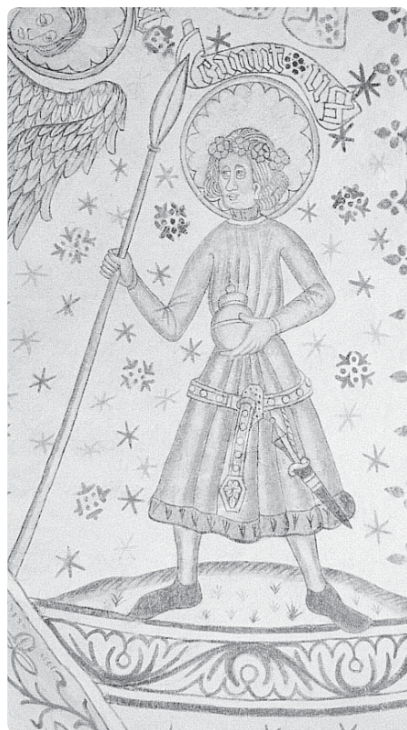
Sv. Knut Lavard

Knut posléze putoval na dvůr saského knížete Lothara (pozdějšího německého císaře, známého i z našich dějin díky drtivé porážce, kterou mu u Chlumce uštědřil kníže Soběslav). Tady nejen nabyl vzdělání, ale i přijal německý styl života, což se projevilo po návratu na Jutský poloostrov. V roce 1115 Knuta sice jeho královský strýc Niels jmenoval jar-