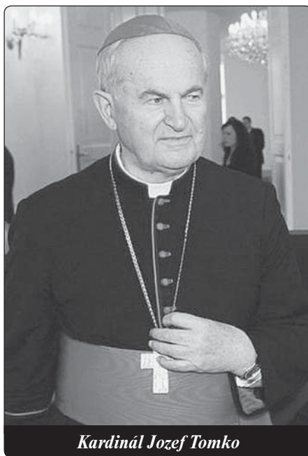
Kardinál Jozef Tomko

z Konstantinopole Bartoloměj, za účasti jiných pravoslavných patriarchů a metropolitů (z Jeruzaléma, Antiochie, Alexandrie, Moskvy, Kypru atd.), jakož i několika desítek tisíc věřících. Všichni jsme si připomenuli starý dokument, edikt, který v Miláně vydal Konstantin Veliký, jehož pravoslavní uctívají jako svatého. Římský císař v něm dovolil náboženskou svobodu pro všechny a ukončil pronásledování křesťanů. Jak to vyzdvihl patriarcha Bartoloměj, byl to skutečný „zvrát v historii lidstva“ a výzva k náboženské toleranci a snášenlivosti. Krásná liturgická slavnost v Niši, stejně jako jiné projevy