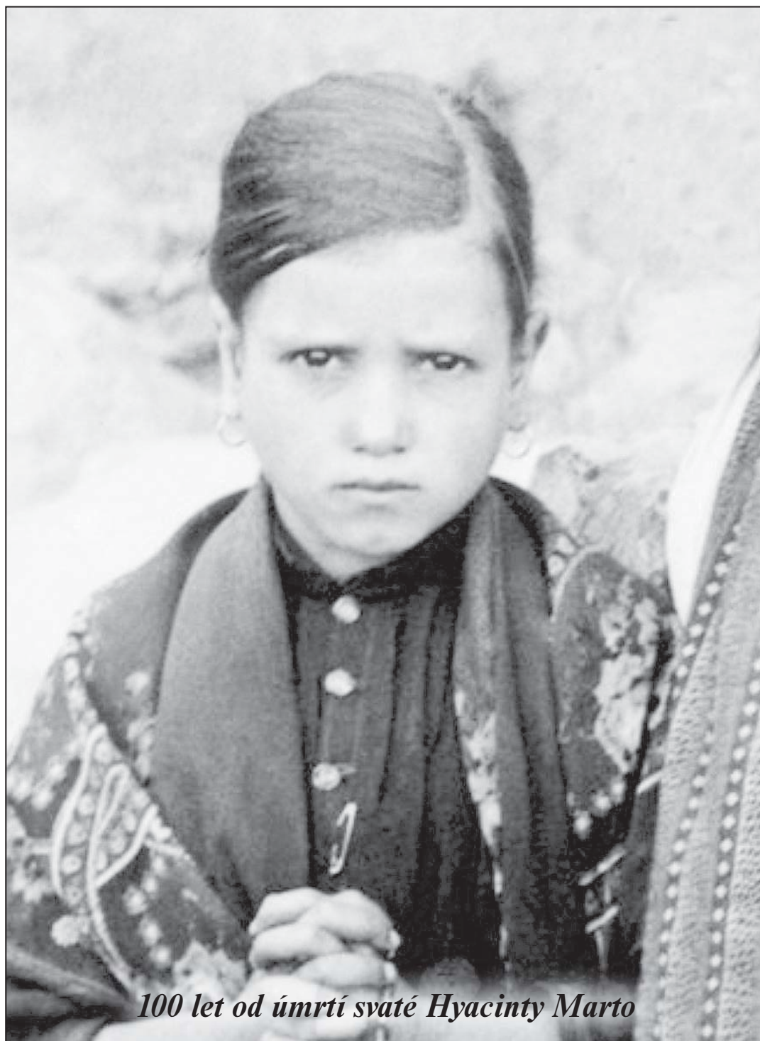
100 let od úmrtí svatě Hyacinty Marto