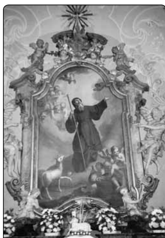
Oltářní obraz kostela sv. Františka z Paoly, Albrechtice v Jizerských horách

František se v ústraní stal otcem sobě samému a své společnosti. V té době panoval zma-