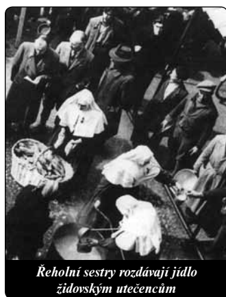
Řeholní sestry rozdávají jídlo židovským utečencům

Izrael Zolli, jehož vědecká pověst se všude šířila, se v roce 1939 stal vrchním rabínem staré a vážené římské církevní obce Židů v diaspoře. Když v roce 1943 německá okupační armáda obsadila Věčné město, snažil se ihned zničit jmenné seznamy uchovávané v synagoze. V synagoze se mu však vysmáli a nevěřili jeho varováním a prozíravým radám. Odpovědní členové židovské obce se nedali přesvědčit, aby uzavřeli synagogu, ani neposlechli výzvy pro spolubratry ve víře, aby se rozptýlili. Následovalo strašné probuzení. Jen několik dnů nato vyzval velitel SS židovskou obec, aby mu do 24 hodin odevzdala 50 kg zlata. V opačném případě zajme 300 židů jako rukojmí. Protože do dalšího dne dokázali shromáždit jen 35 kg, vypravil se hlavní rabín poprvé ve svém životě jako stavební inženýr tajně do Vatikánu, kde apeloval na Pia XII.: Ani v minulosti se nestalo, že by No-