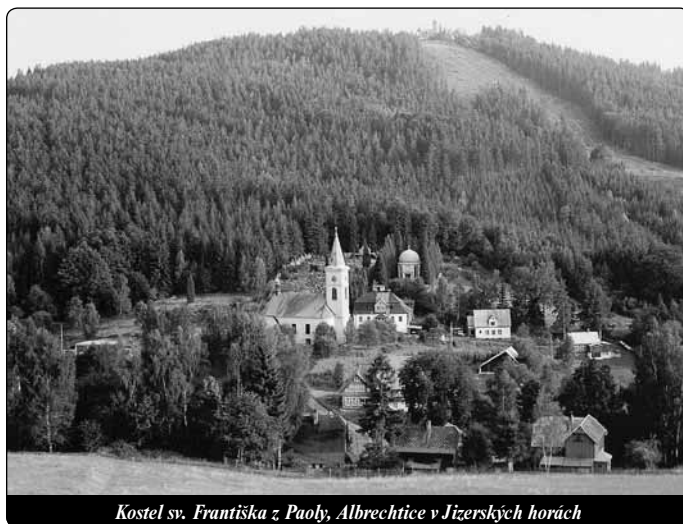
Kostel sv. Františka z Paoly, Albrechtice v Jizerských horách

Zakladatel a generální představitel řádu Nejmenších bratří, mnich František z Paoly, zemřel na Velký pátek 2. dubna 1507.