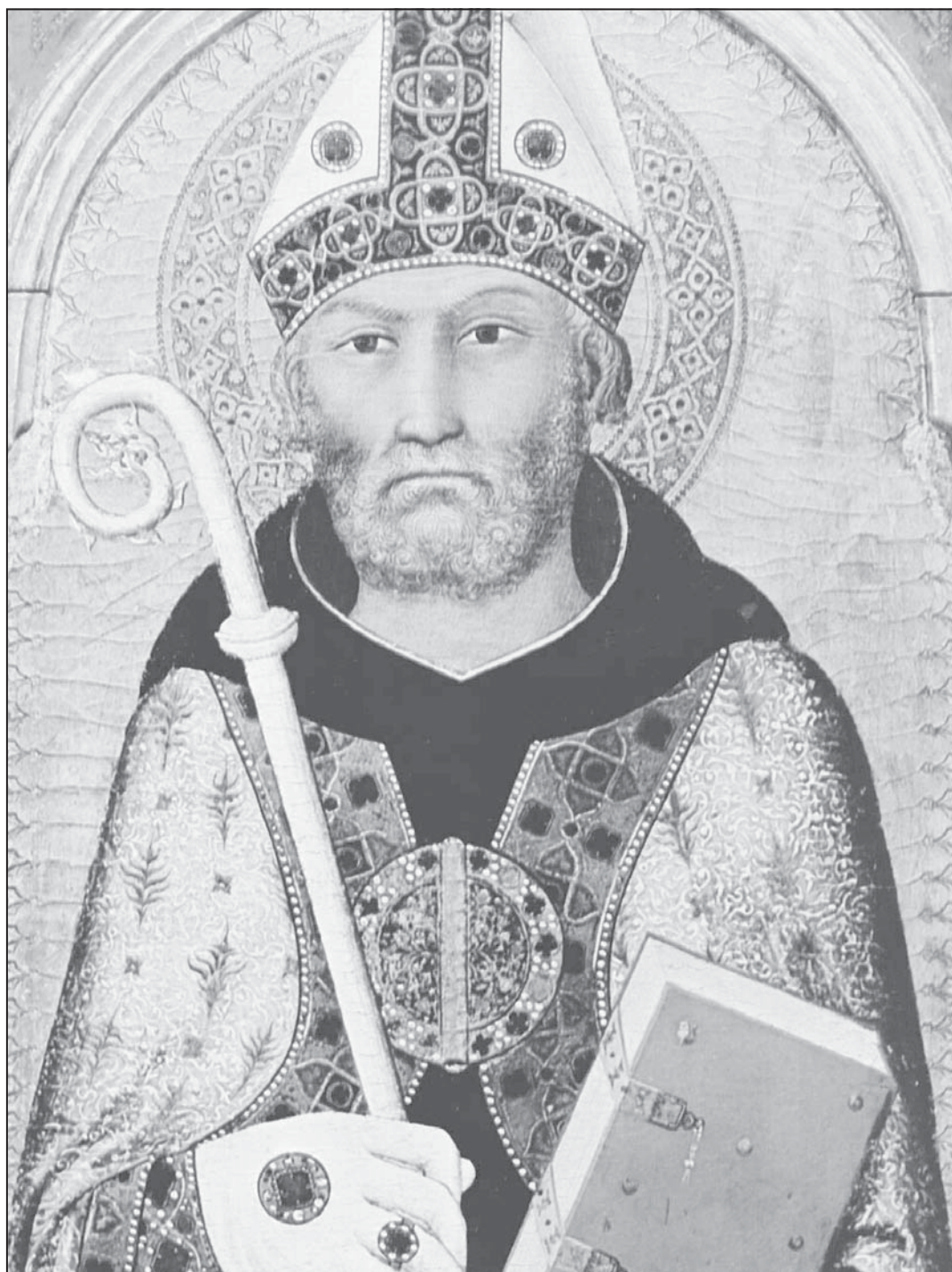
Simone Martini (kolem 1284-1344): Svatý Augustin