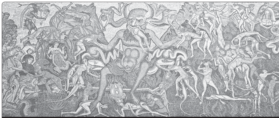
Coppo di Marcovaldo (asi 1225–1276): Peklo, baptisterium, Florencie

Bůh odpouští vždycky, to dosvědčuje Písmo svaté, především evangelium. Zavržení je ostatně právě odmítnutí odpu-