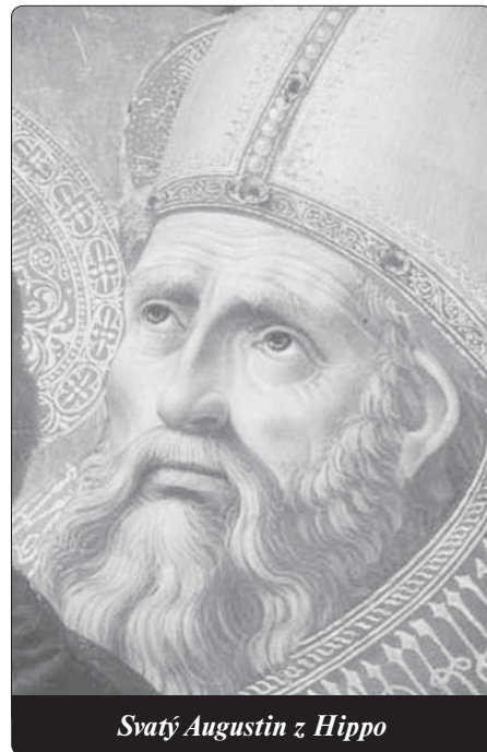
Svatý Augustin z Hippo

Ve stavu náboženského neklidu a nejistoty opustil dům, v němž pobýval v Miláně jako host, a šel do zahrady, následován svým přítelem Alypiem. Tam mu vyznal svoji bídu a propukl v pláč. Vzdálil se od Alypia, v pláči se položil pod fíkovník a mluvil k Bohu. Náhle uslyšel dětský hlas, který stále znovu volal: „Tolle, lege!“, což přeloženo znamená: Vezmi, čti! Protože znal podobný příběh o otci pouště a poustevníkovi Antonínovi, vykládal si tuto událost následovně: Bůh mu poručil, aby otevřel knihu a četl to místo, na které poprvé padne jeho zrak. Vrátil se k Alypionovi zpátky, otevřel stránky s Pavlovými dopisy a četl: „Jak se sluší za dne, chovejme se důstojně: žádné hodování ani hýření, žádná chlípnost ani prostopášnost,