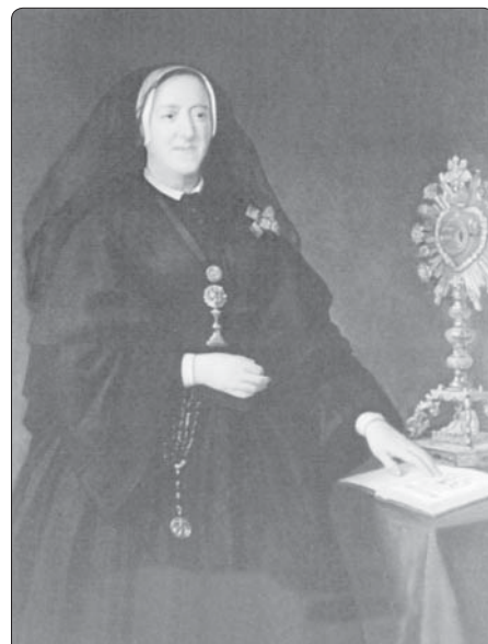
Tento obraz byl namalován měsíc před smrtí Matky Michaely na výslovné přání španělské královny Izabely II.

Tento odvážný krok, kterému Michaelina rodina ani nerozuměla, ani jej neschvalovala, byl zároveň skromným začát-