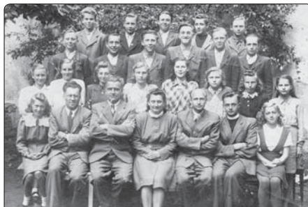
Jan Bula s vyučujícími a žáky měšťanské školy na Sádku

Bula byl soudně rehabilitován v roce 1990. Diecézní fáze beatifikačního procesu byla zahájena v roce 2004.