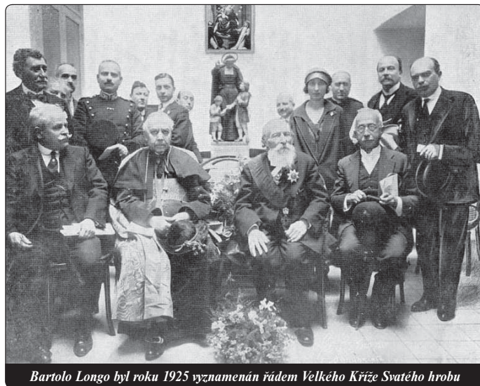
Bartolo Longo byl roku 1925 vyznamenán řádem Velkého Kříže Svatého hrobu

V tomto období dozrál jeho nejoriginálnější nápad: nabytí přesvědčení, že děti vězňů je možno nejen získat pro Boha, ale přivést je k tomu, aby zachránily své rodiče ze zoufalství. V roce 1892 byl položen první základní kámen hospice pro děti trestanců, který pak od roku 1907 vedli bratři sv. Jana Křtitele de la Salle. Po šesti letech získali tito žáci další středisko.