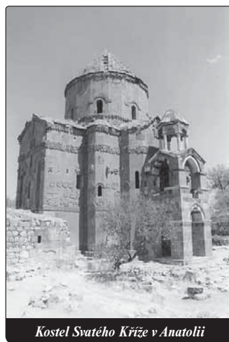
Kostel Svatého Kříže v Anatolii

že v jižní Anatolii. Jak oznámila turecká média, toto rozhodnutí vyšlo od tureckého ministerstva zahraničí.