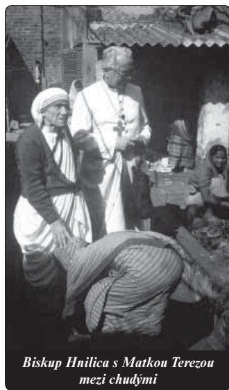
Biskup Hnilica s Matkou Terezou mezi chudými

V Římě se vyskytlo několik překážek a nakonec musel zasláhnout sám Svatý otec, aby se v roce 1968 mohly sestry Matky Terezy usadit v jedné barákové čtvrti. Biskup Hnilica často vyprávěl, jak konečně Matka Tere-