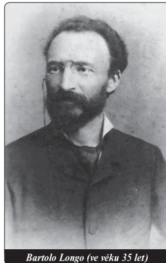
Bartolo Longo (ve věku 35 let)

vám, a proto po návštěvě u papeže Lva XIII. se oba rozhodli, že uzavřou manželský sňatek, ale budou nadále žít jako dobří přátelé jen v bratrské lásce, jak to dělali doposud. Manželství uzavřeli v naprosté tichosti.