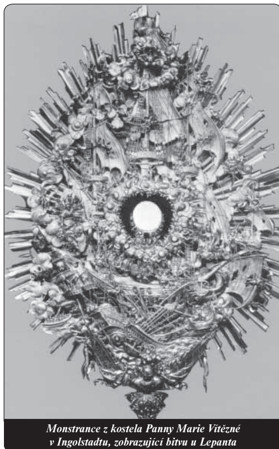
Monstrance z kostela Panny Marie Vítězné v Ingolstadtu, zobrazující bitvu u Lepanta

U Lepanta, která má podobné členění. Na patě monstrance byl zobrazen klečící Turek. Měl vyjadřovat trvalé ohrožování, napadání a osočování Církve. (Po nástupu sekularizace byl z monstrance odstraněn.)