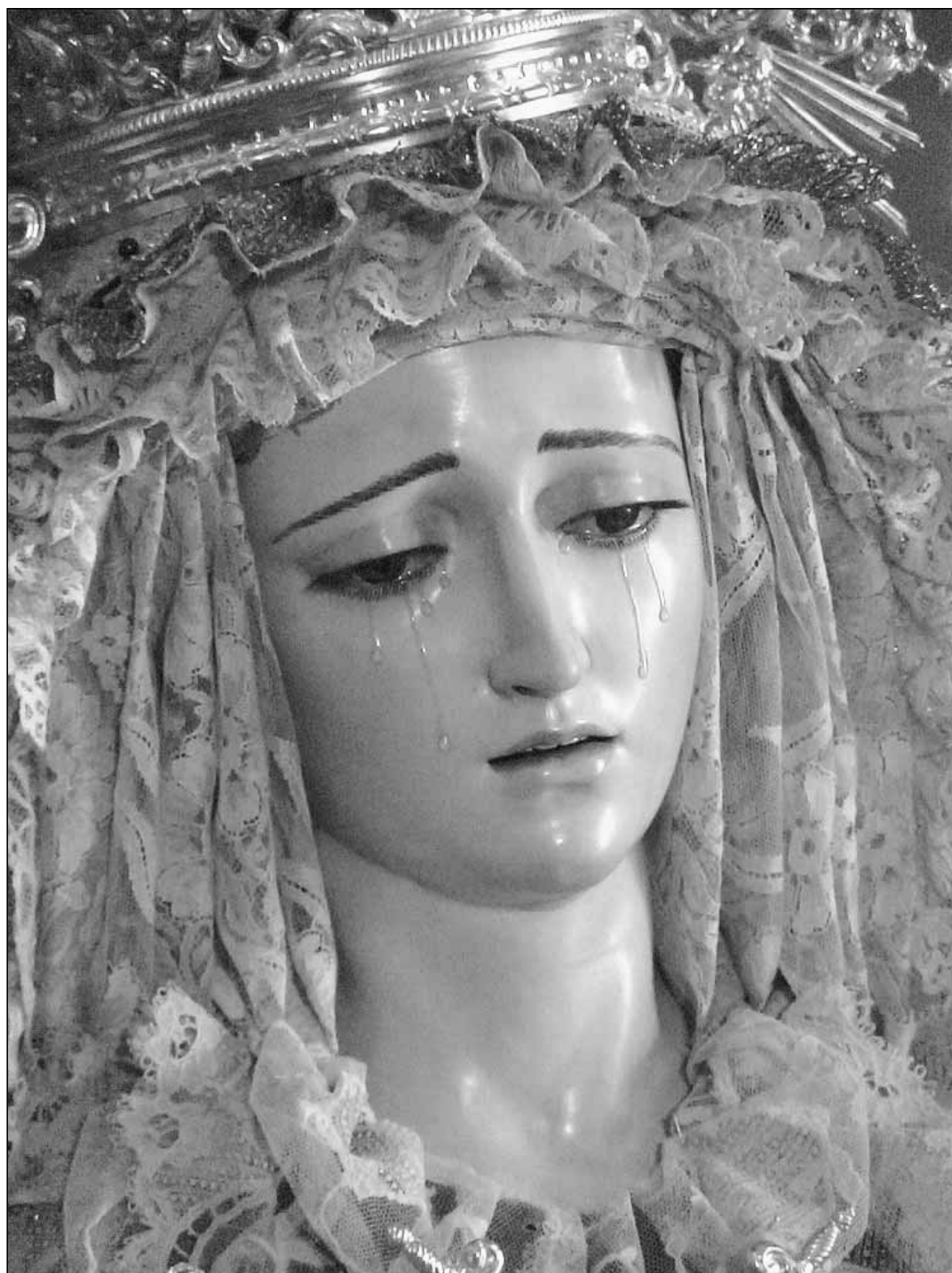
Socha pláčící Madony z chrámu sv. Mikuláše v Cadizu ve Španělsku