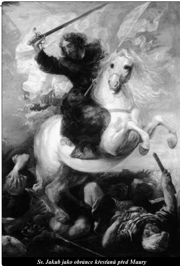
Sv. Jakub jako obránce křesťanů před Maury

Vývoj počtu poutníků se dá poměrně snadno sledovat. Každý, kdo urazí alespoň posledních 100 km pěšky nebo 200 km na koni či na kole, obdrží v poutní kanceláři oficiální potvrzení tzv. „Compostella“. Před 30 roky byl tento počet na absolutně nejnižší úrovni. V celém ro-