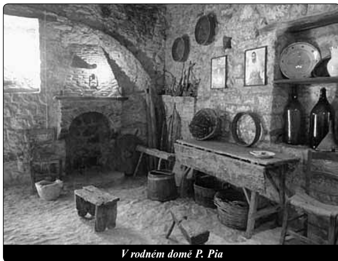
V rodném domě P. Pia

Když skončil rok noviciátu, přesídlil bratr Pio do kláštera