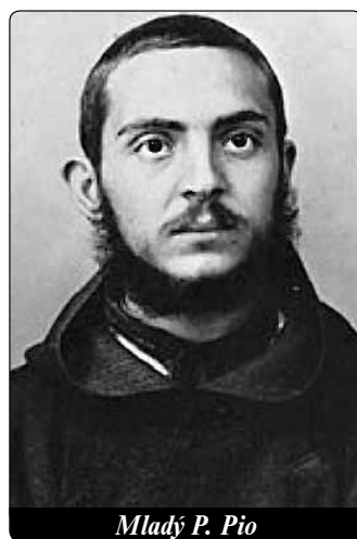
Mladý P. Pio

Během noviciátu v klášteře v Morcone nebyla láska bratra Pia k matce o nic menší. Je známá epizoda z návštěvy jeho matky u něho v onom roce. Bratr Pio, kapucínský novic, k ní přišel plný pokory, se sklopeným zrakem, aniž by vyslovil jediné slovo. Jeho matka tím byla velice překvapená a zeptala se ho starostlivě: „Můj synu, ty jsi