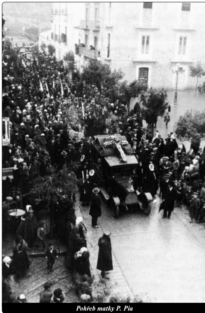
Pohřeb matky P. Pia

Nevíme nic o té době, kdy Pater Pio žil ze zdravotních důvodů doma, nejdříve jen s matkou