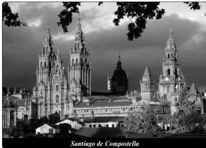
Santiago de Compostella

Ve středověku se stalo Santiago de Compostella po významných místech ve Svaté zemi