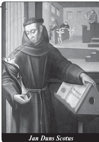
Jan Duns Scotus

Předmětem úvah Doctora subtilis je nejen role Krista v dějinách spásy, ale také role Mariina. V době Duns Scotu velká část teologů vyslovovala námitky, zdánlivě nepřekonatelné, proti nauce, podle které nejsvětější Maria byla uchráněna dědičného hříchu od prvního okamžiku svého početí: pokud jde o univerzálnost vykoupění, které způsobil Kristus, ta se mohla jevit ohrožená podobným tvrzením, jako by Maria ke svému vykoupění nepotřebovala Krista. Proto se teologové stavěli proti této tezi. Duns Scotus tedy, aby vysvětlil toto uchránění od dědičného hříchu, rozvinul argument, který pak použil také blahoslavený Pius IX., když definoval slavnostně dogma o Neposkvrněném Mariině početí. Je to onen argument o „předvykoupění“, podle kterého je Neposkvrněné početí mistrovským dílem vykoupění způsobeného Kristem, protože právě síla jeho lásky a jeho prostřednictvím dosáhla toho, že Matka byla uchráněna dědičného hříchu. Maria je tedy plně vykoupěna Kristem, ale již před svým početím. Františkáni, jeho spolubratři, přijí-