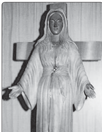
Plačící socha Panny Marie v Akitě