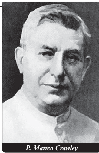
P. Matteo Crawley

ruje kajícímu v nekonečném milosrdenství nebe.