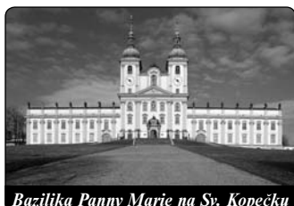
Bazilika Panny Marie na Sv. Kopečku

Podíl na moci, o níž sice ve školách mylně říkali, že pochází z lidu, přibližuje k Bohu. V horším případě je podíl na moci po-