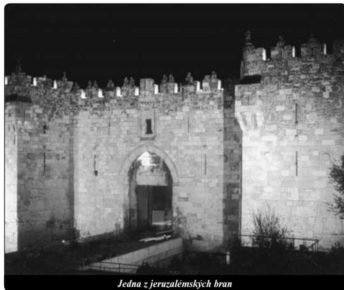
Jedna z jeruzalémských bran