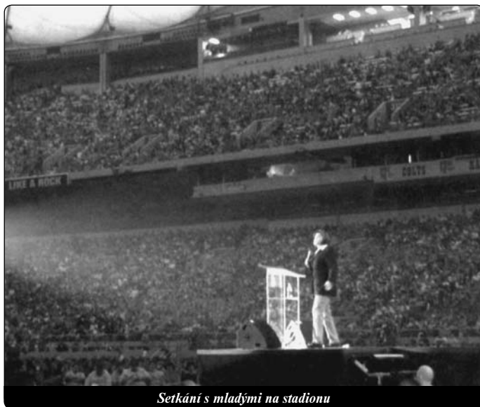
Setkání s mladými na stadionu

Mnohokrát přišly do mé poradny pro těhotenský test na smrt vylekané dívky. Když jsem jim řekla, že výsledek testu je negativní, zhluboka si oddechly. Obyčejně chtěly hned odejít, ale já jsem je prosila, aby počkaly a nechaly si udělat test AIDS, příjice, kapavky, zavšivení lůna, zánětu močových cest... Ptaly se udiveně: Proč bych měla být nakažena nějakou chorobou? Milé dívky, máte čtyřikrát větší riziko, že se nakazíte pohlavní chorobou, než že otěhotníte. Ale dnes si s tím dívky nedělají starosti. Hlavně že neotěhotněly. V každé škole, ve kterých se setkávám s dopívajícími dívkami, se některá dívka přizná, že jí matka poradila, aby používala antikoncepční tabletky. Před