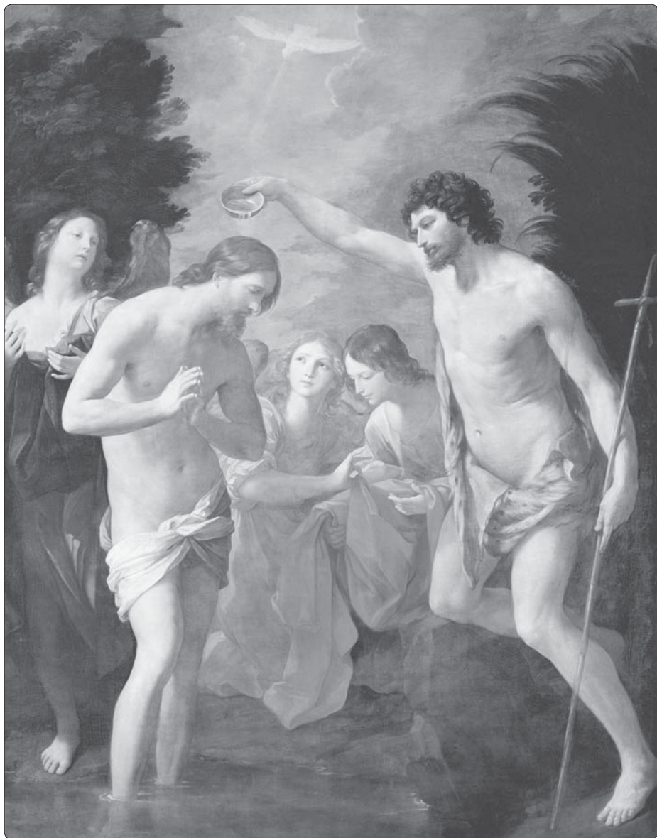
Guido Reni (1575–1642): Křest Páně

Náš křest. Byli jsme pokřtěni křtem, který ustanovil Ježíš jako svátost. Jan Křtitel řekl o Ježíši: „On vás bude křtít v Duchu Svatém a v ohni.“ (Mt 3,11) Timto Ježíšovým křtem jsme byli pokřtěni a tento