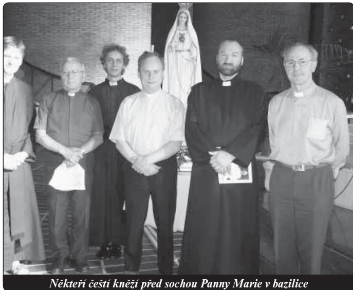
Někteří čeští kněží před sochou Panny Marie v bazilice

V této době, kdy se vyučují a rozšiřují mnohé omyly, jež mnohé vzdalují od víry, a kdy se zdá, že již nadešla hodina velké apostaze, jak ji předpovídá Písmo, musíme být spojeni s papežem a následovat jeho osvětlené Magisterium, pokud chceme zůstat stále v pravé víře.