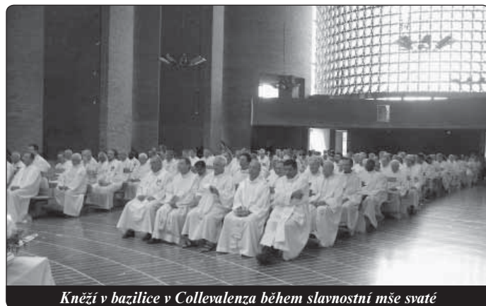
Kněží v bazilice v Collevaleza během slavnostní mše svaté