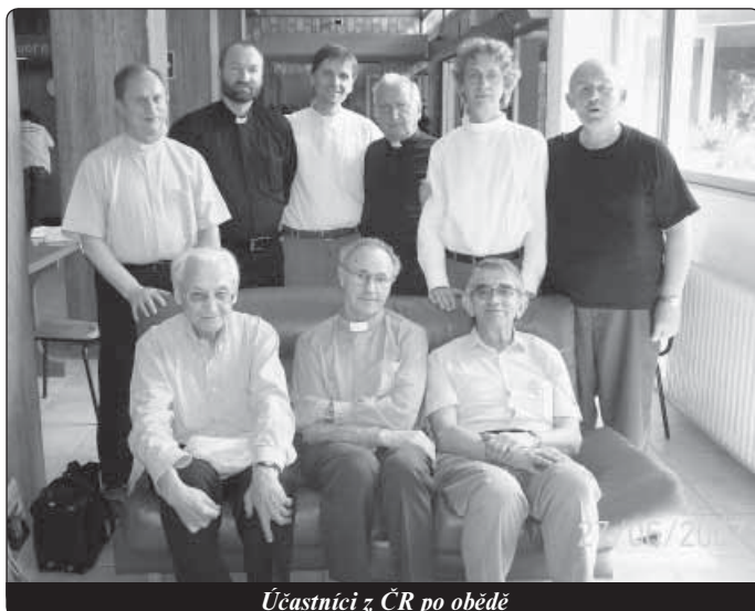
Účastníci z ČR po obědě

„Dnes, kdy na všechno padá tma a kdy se stále více šíří v Církvi blud, vy musíte všem ukazovat cestu k pramenu, z něhož Ježíš nechává vyvěrat svá slova pravdy, totiž k evangelium svěřenému hierarchické Církvi, to je papeži a biskupům s ním spojeným. (...) Dnes tak zraňuje a zarmucuje mé Srdce, Srdce Matky Církve, též pohoršení biskupů, kteří neposlouchají zástupce mého Syna a strhují velký počet mých ubohých dětí na cestu bludu. Proto vy musíte dnes svým slovem důrazně hlásat všem, že Ježíš ustanovil jen Petra jako základ své Církve a neomylného strážce pravdy.“ ( Kněžím, přemilým synům Panny Marie, 7. srpna 1976 )