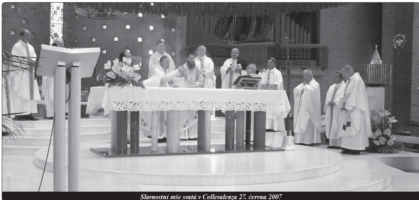
Slavnostní mše svatá v Collevaenza 27. června 2007

Především musíme poslechnout normy jím vydané, které se týkají úpravy svaté a božské církevní liturgie. Proto vyzývám kněze MKH, aby se přizpůsobili všemu, co je obsaženo