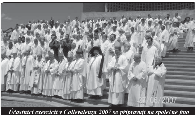
Účastníci exercicií v Collevaenza 2007 se připravují na společné foto