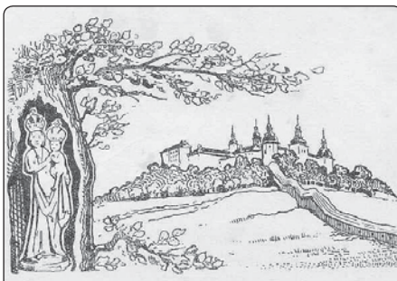
Svatohorská Madona - dobová kresba