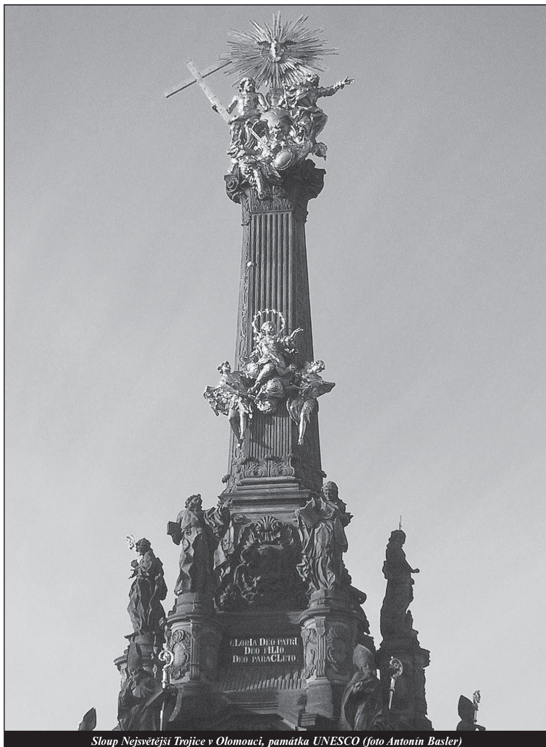
Sloup Nejsvětější Trojice v Olomouci, památka UNESCO