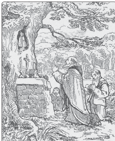
Uctívání Svatohorské Madony v úkrytu před Švédy