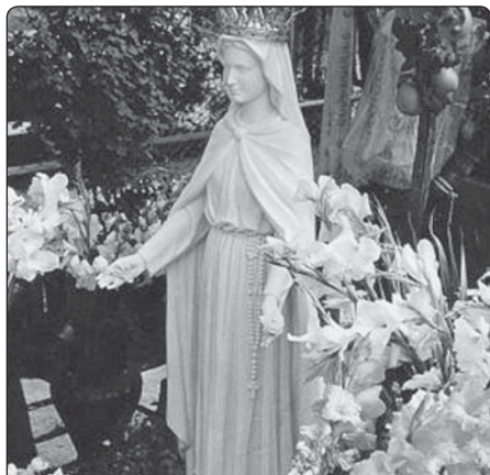
Milostná soška Panny Marie v San Damiano

► Moje děti, zpívejte přes den hymny chvály na Ježíše, děkujte mu za všechno, co pro vás vykonal, a za velké milosrdenství, které vám prokazuje. Vrhněte se k jeho nohám a prostě o smilování, vždyť Ježíš je Král králů a může vám dát všechno. Zasvěťte se jemu tělem a duší, darujte se jemu s tělem a duší, darujte se jemu úplně – také všechny vaše hříchy, které Ježíš zničí. A On zapálí vaše srdce silnou láskou.