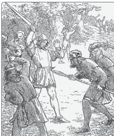
Rytíř Malovec se brání lupičům

K posvátnému poutnímu místu nad hornickou Příbramí se váží četné příběhy, uchovávané v paměti lidu a publikované ještě v časech, kdy křesťanský pohled