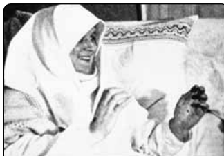
Velikonoční ráno roku 1936. Místo kněze, který ji přináší sv. přijímání, vidí Terezie v extázi, jak se k ní přibližuje Ježíš

Blahoslavená Resl byla v den blahorečení Terezičky 19. dubna 1923 uzdravena z ochrnutí a v den svatořečení 17. května 1925 ze slepoty. Terezička ji také v jednom zjevení řekla: „Úplně sebeobětování a radost z utrpení nás těší.“