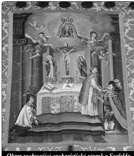
Obraz zachycující eucharistický zázrak v Seefeldu

ře, ale oltář se počal naklánět i s ním, jako by se chtěl na něho zřítit. Tvrdý kámen oltáře byl jako z vosku a otisk rytířovy pra-