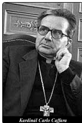
Kardinál Carlo Caffara

Večer na první Zelený čtvrtek se všechno obnovuje: nová smlouva, nové kněžství. Nový zákon, protože Kristus tím, že