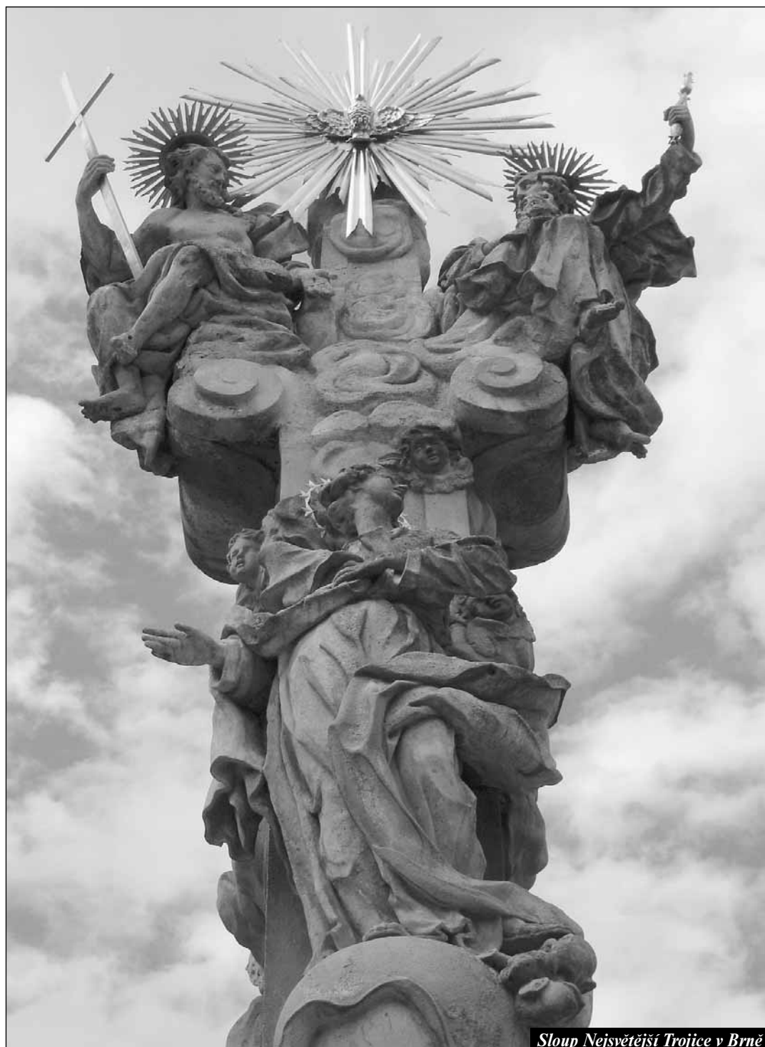
Sloup Nejsvětější Trojice v Brně

Společně pro Evropu Jan Graubner - strana 11 -