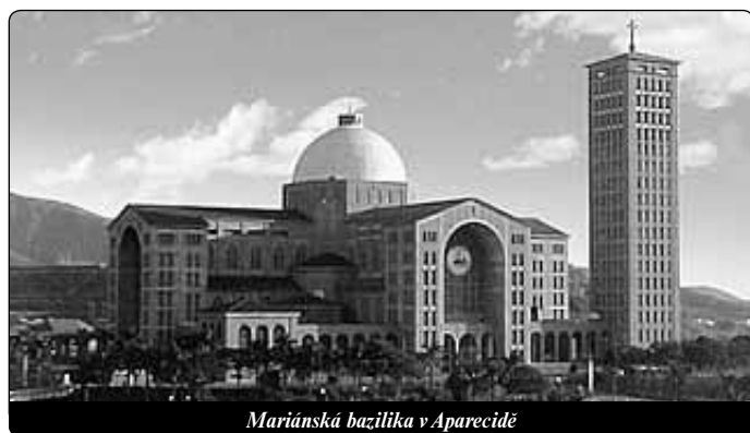
Mariánská bazilika v Aparecidě

Katolík se může opravdu angažovat pro lidskou společnost jen jakožto katechezi vyzbrojený a Eucharistií živený člen Církve. Je velice důležité, že Svätý otec přitom upozorňuje na Katechismus katolické církve a na Kompendium sociálního učení. Zdůrazňuje nezbytnost „provádět sociální katechezi“ v pravém slova smyslu a zajistit přiměřenou vzdělanost v sociálním učení Církve. Bez dobré individuální a společenské morálky není možno zajistit sociální spravedlnost. Z toho plyne potřeba Boha ve veřejném životě, aby bylo dosaženo vyššího stupně morálky.