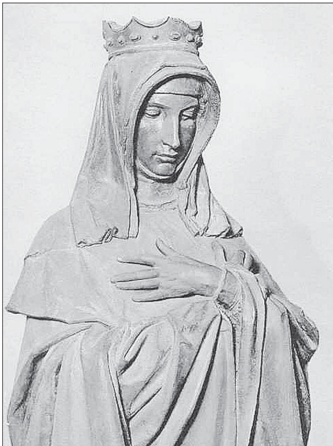
J. V. Myslbek (1848-1922): Svatá Anežka

za počatý lidský život sobota 1. prosince 2012 před 1. nedělí adventní - strana 12 -