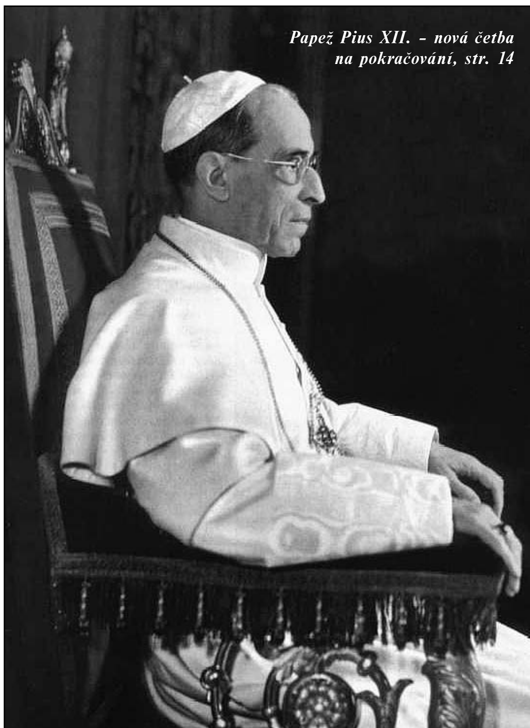
Papež Pius XII. - nová četba na pokračování, str. 14