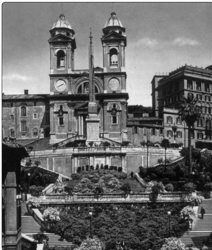
Kolej Trinità dei Monti v Římě