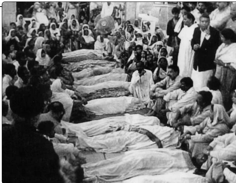
Osmnáct zavražděných křesťanů, kteří se účastnili mše svaté v pákistánském Bahawalpuru