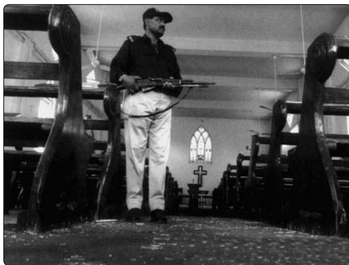
Tragický každodenní obraz v mnoha zemích: pronásledování a teror namířený proti křesťanům.