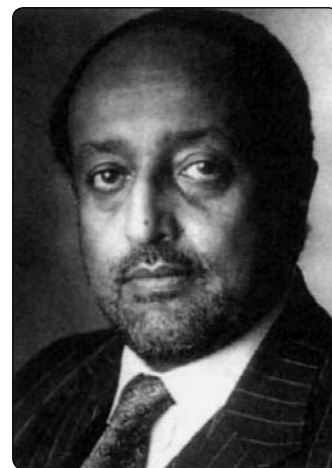
Princ Asfa-Wossen Asserate, etiopský spisovatel

Když někdo vstupuje do svatyně náboženského společenství, ke kterému nepatří, musí si být vědom, že toto místo je lidem, kteří zde navštěvují bohoslužby, posvátné. Kdo není katolík, nemusí se poženat svěcenou vodou ani pokleknout, ale musí vědět, že oltář označený červenou svítilnou označuje místo, kde se přechovávají proměněné dary, které pro katolíka představuje zónu nejvyšší úcty, že zde je možno mluvit jen co nejméně a velmi ztišeným hlasem, že se nesluší zůstat stát zády k oltáři