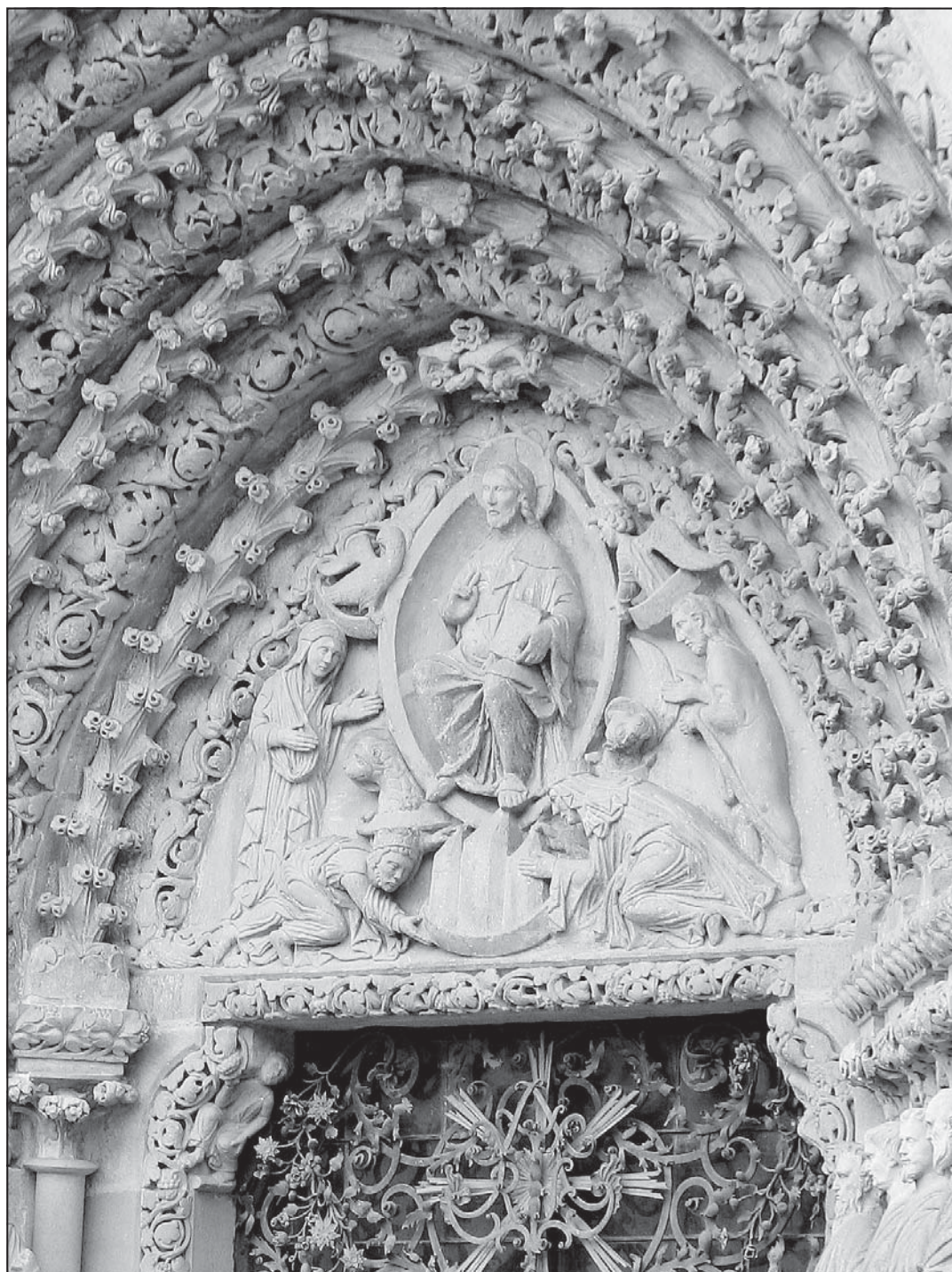
Tympanon nad vstupem do kostela kláštera sester cisterciáček Porta coeli v Předklášteří u Tišnova