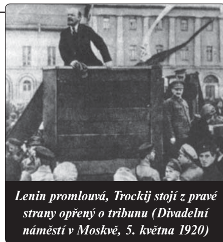
Lenin promlouvá, Trockij stojí z pravé strany opřený o tribunu (Divadelní náměstí v Moskvě, 5. května 1920)

Podrobný plán zničení „buržoazní rodiny“ narýsoval téměř čtyřicet let po pu-